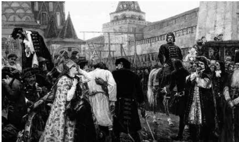
Василий Суриков. Утро стрелецкой казни