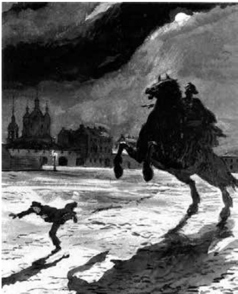
Иллюстрация А. Бенуа к поэме Пушкина «Медный всадник»