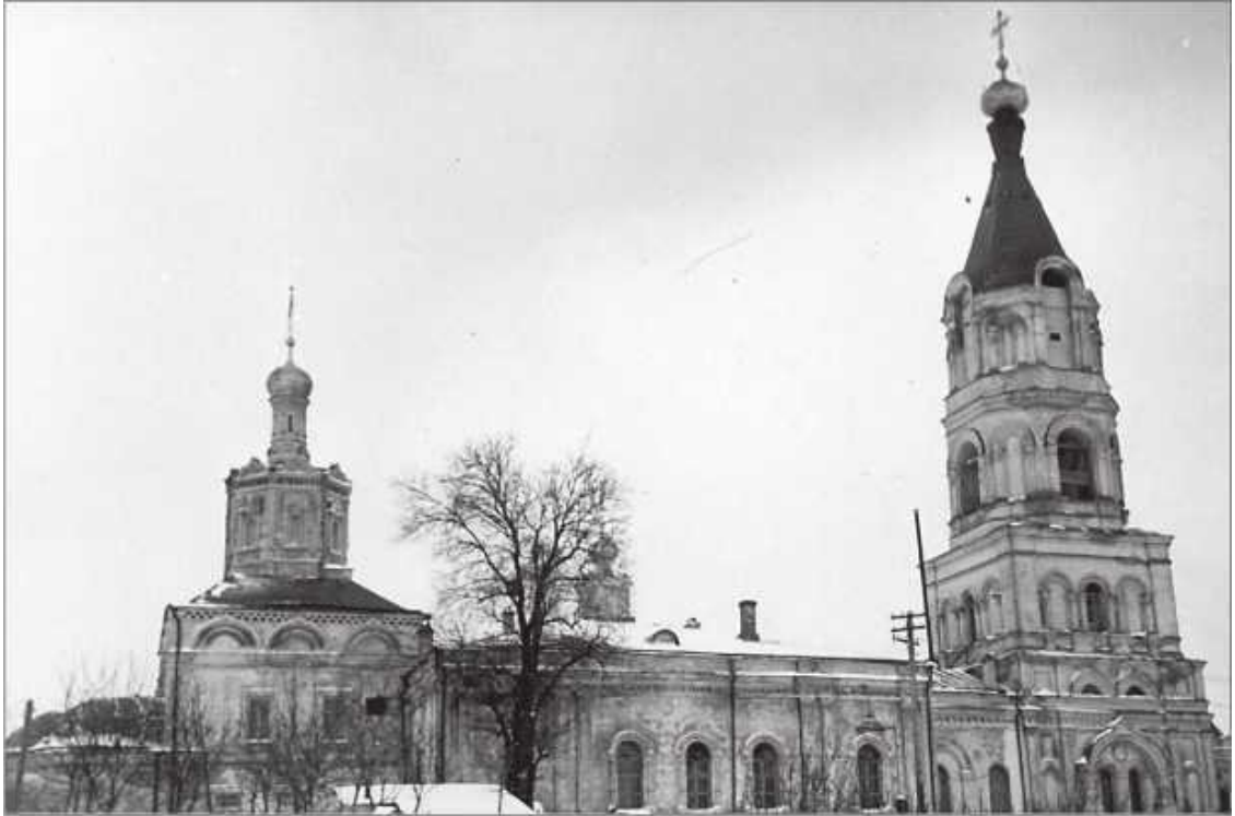
Собор святых Бориса и Глеба в Рязани. Здесь были обретыны мощи сет. Василия Рязанского

Святитель Василий в сопровождении князя и народа взошел в соборный храм и отслужил вечерню. С того времени епископская кафедра утверждалась в Рязани (Старой), в Муроме же была упразднена, а муромлян народ стал называть «святогоднами».