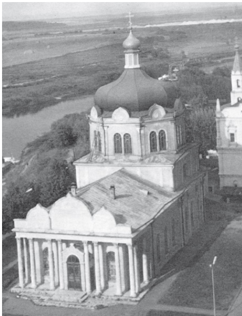
Христорождественский собор в Рязанском кремле. Здесь ныне покоятся мощи свт. Василия Рязанского