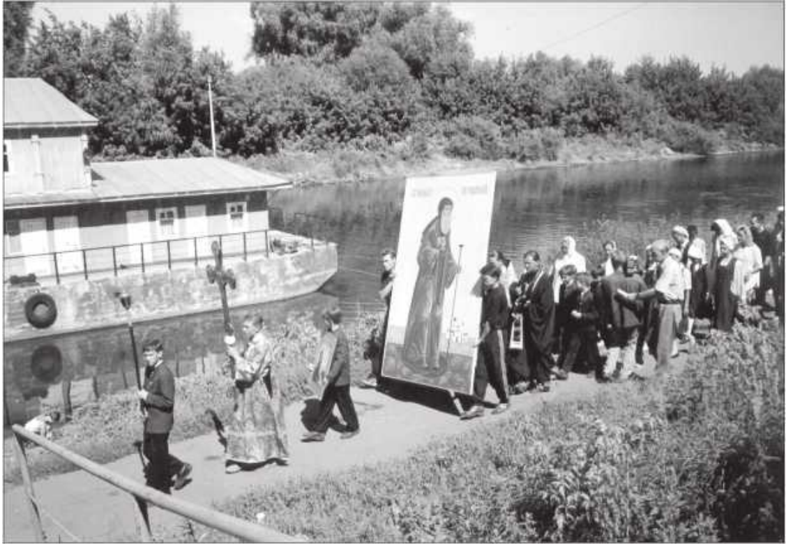
Крестный ход с иконой сет. Василия во время летней регаты православного лагеря по пути чудесного шествия святителя по водам (лето 1999 года)

Предание говорит, что жители Рязани пред самым прибытием святителя собрались в храм к вечернему богослужению, но диакон, вышедший в облачении начинать службу, не мог произнести обычного начала. Народ смотрел на это с изумлением. Наконец диакон, как бы разрешенный от уз, связывавших его уста, невольно провозгласил: «Не могу начинать. Владыка прибыл, владыку встречайте!» И весь собор пастырей со святыми крестами, князь с боярами и народом поспешили выйти на берег Оки в сретение богоявленному святителю и, видя его плывущим на мантии с Пречистым образом Богоматери, с великой радостью приняли к себе. Предположительно это случилось до 1288 года.