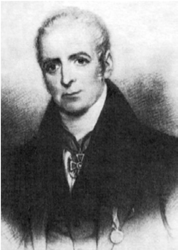
Рис. 2. Изобретатель паровых машин, инженер, механик и предприниматель Чарльз Берд (1766–1843)