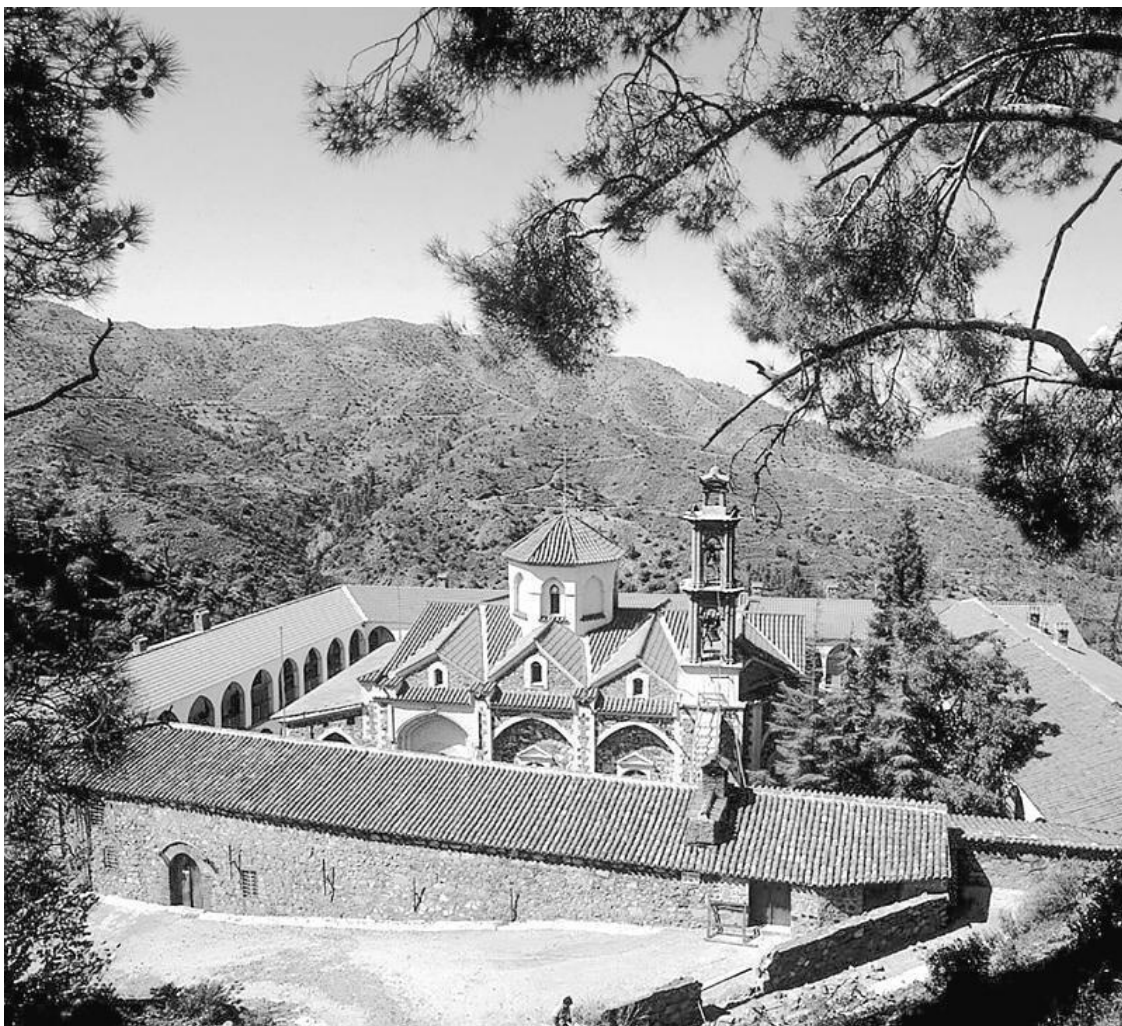
Монастырь Божией Матери Махера