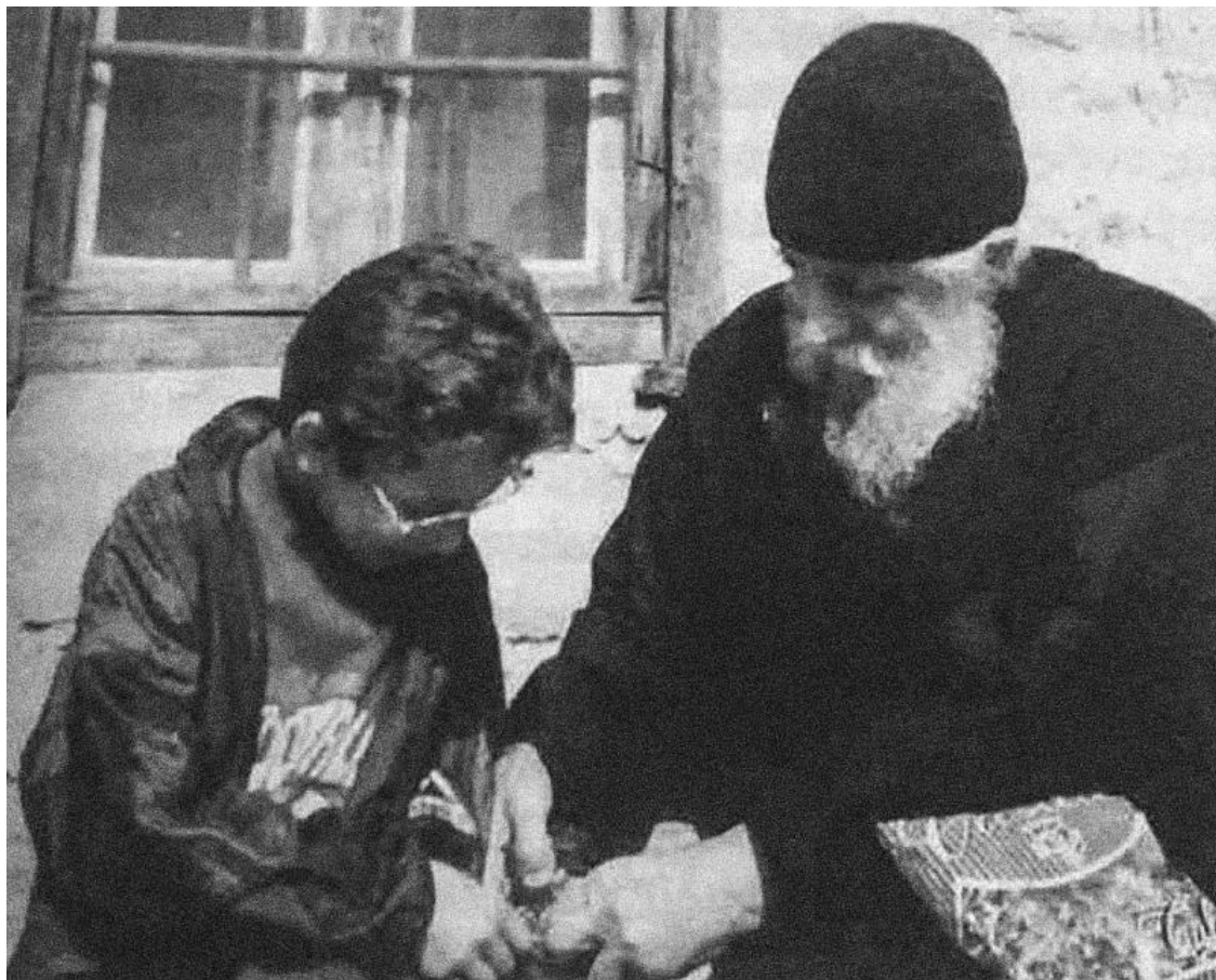
Преподобный Паисий Святогорец

Христианину нужно приобрести сердце кроткое и любвеобильное. Мы можем внешне вести себя вежливо и учтиво, но вежливость эта может быть жесткой, мертвой. Эта вежливость будет просто обходительностью и приобретенным навыком поведения. Мы, монахи и христиане, не придаем светской внешней вежливости очень большого значения. Человек может не знать внешнего этикета: например, как войти в какой-нибудь аристократический дом, как себя там вести и держаться, как пользоваться всевозможными столовыми приборами, – и при этом обладать редким душевным благородством и тонкостью.