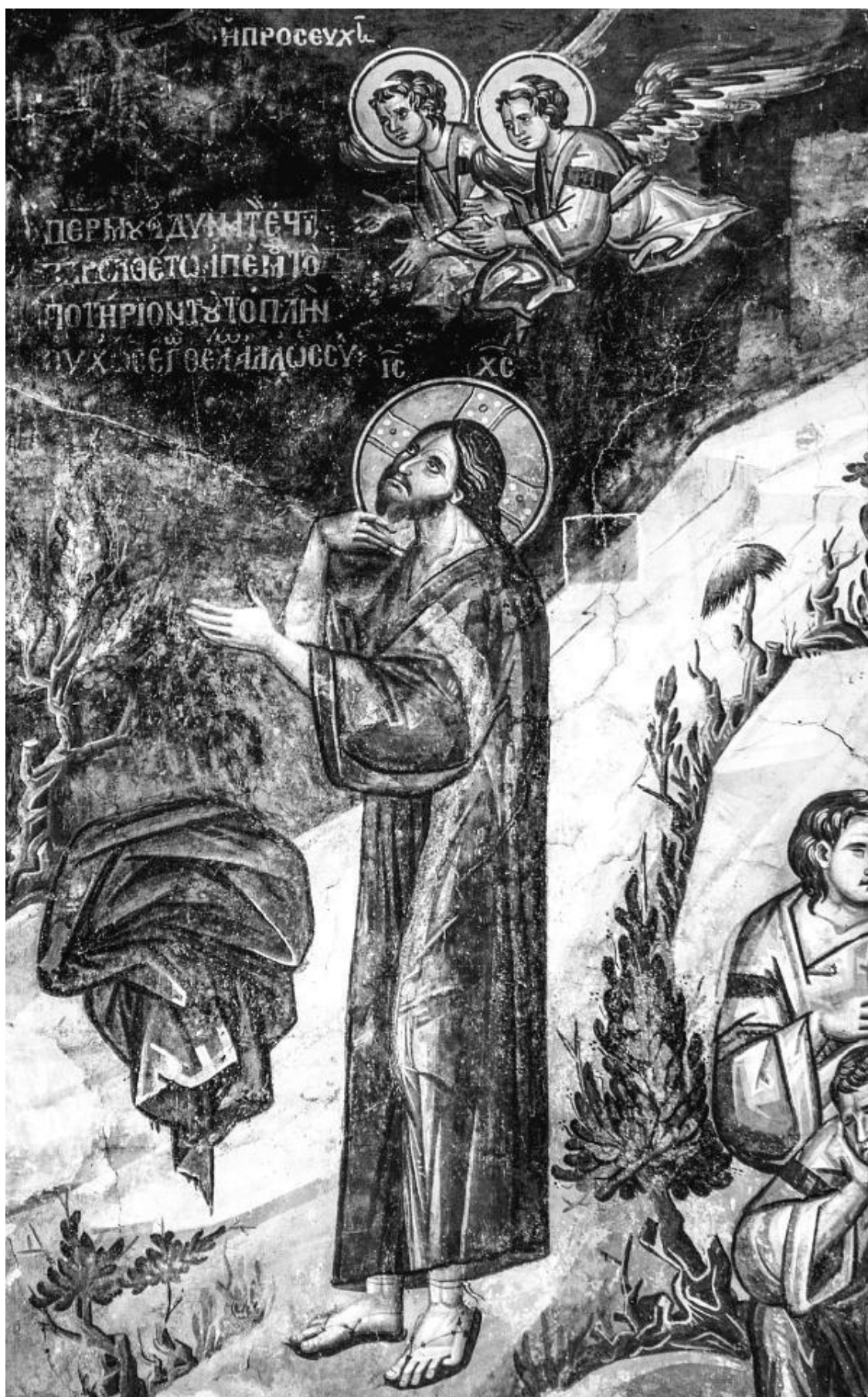
Моление о Чаше