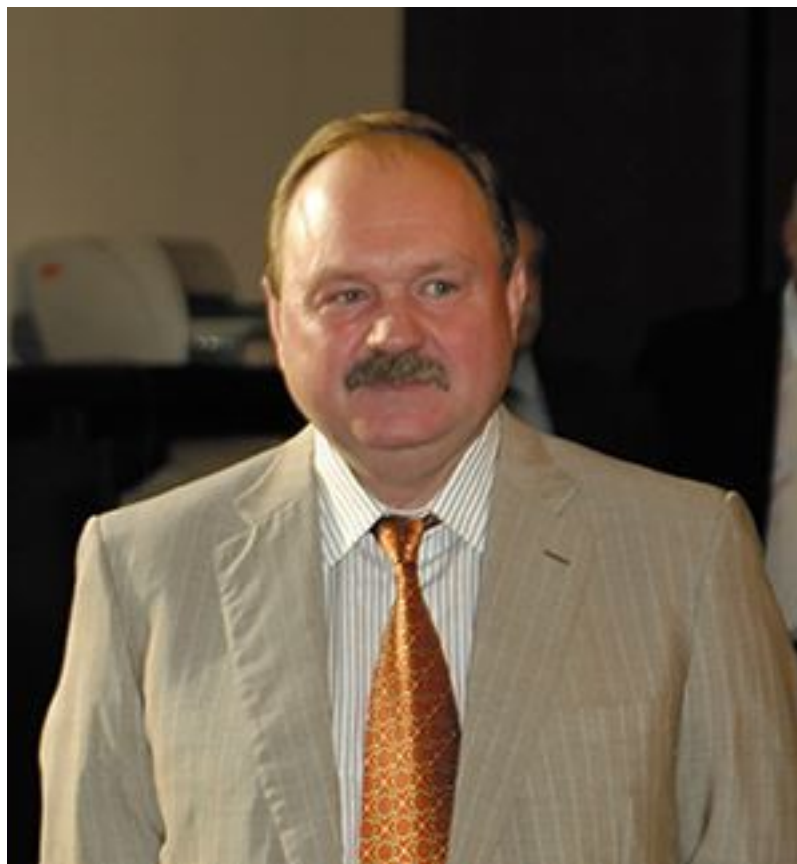
Репродукция № 6.