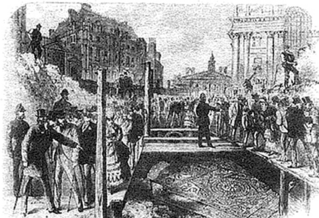
Раскопки древнеримского тротуара в Уолбруке, 1869 г.

Как только на этой земле был построен город, он стал постепенно опускаться. С течением времени первые этажи превратились в цокольные, а входная дверь стала дверью в подпол. Улицы тогда располагались на уровне первого этажа. Самые древние из этих руин находятся на глубине 26 футов. А вся история города в сжатом виде составляет 30 футов.