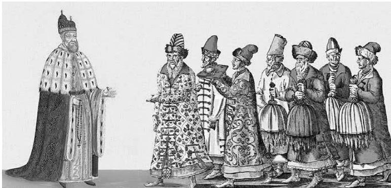
Прием венецианским дожем посольства москвитов. Рисунок xv в.