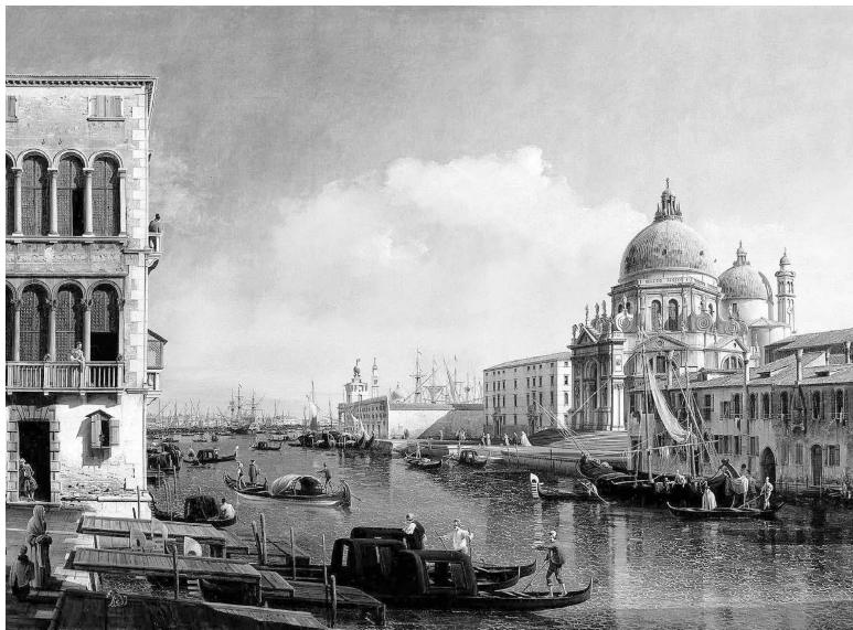
Вид на Большой канал. С картины Б. Белотти.

гда не видел. И вот наконец они в Италии, в нескольких часах пути, но деньги за оконченный и отосланный в “Русский вестник” роман все не идут и не идут, и Достоевские застревают на все лето в раскаленной от жары Флоренции. Понятно, что после этого увиденная таки Венеция показалась им воплощенным раем.