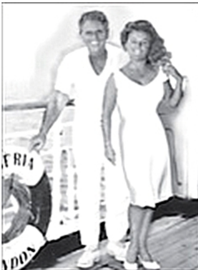
Крестоносцы здоровья Поль Брэгг и его дочь Патриция

Позвольте поделиться с вами нашим опытом использования мощной нервной силы для преодоления усталости. Моему отцу довелось в полной мере прочувствовать, какой становится жизнь человека, обессиленного до такой степени, что каждая клеточка его тела буквально кричит от неимоверной слабости! В свое время он был настолько болен и слаб, что не мог оторвать голову от подушки. Но, когда он изменил свой образ жизни, его здоровье пришло в норму.