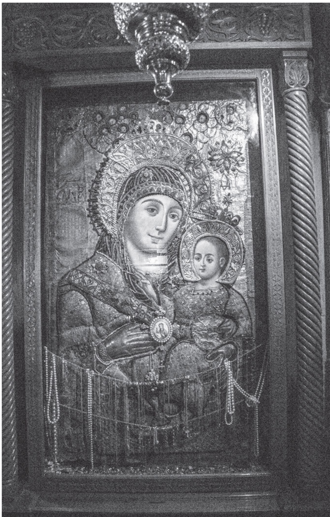
Икона Божией Матери в храме Рождества Христова в Вифлееме