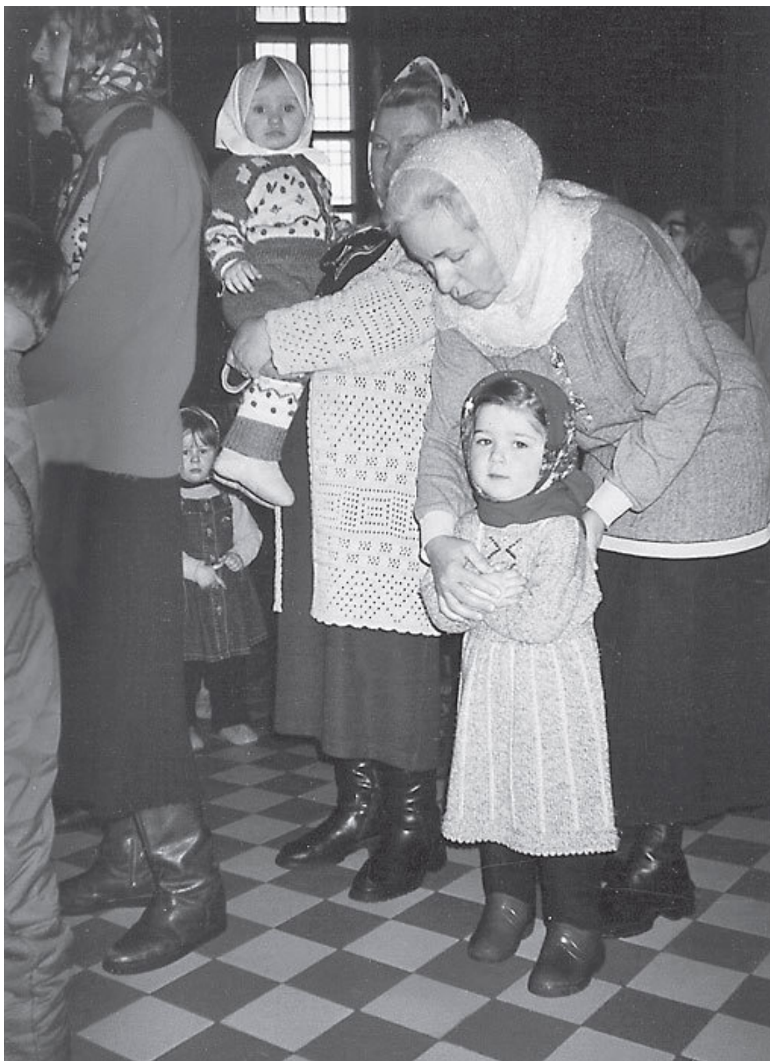
Перед Святым причастием 25 февраля 2001 года