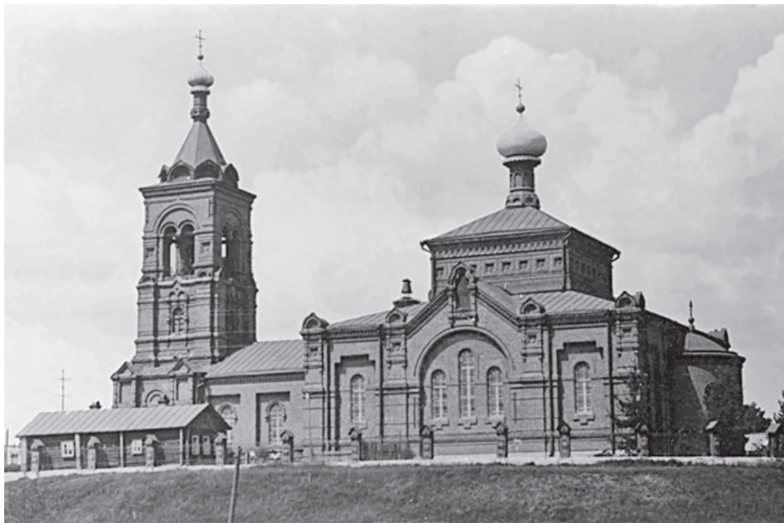
Свято-Успенский храм вскоре после постройки