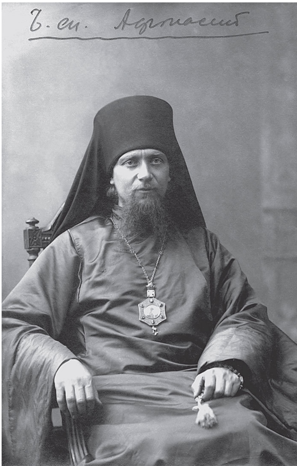
Епископ Афанасий (Сахаров) 1925 год