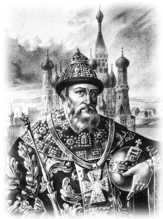
Иван IV Грозный