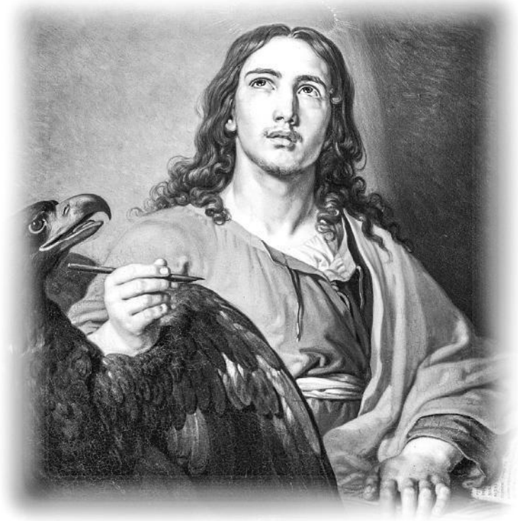
«Иоанн Богослов». В. Л. Боровиковский

Луна, уступая место первому солнечному лучу, на прощание осветила очертания странной фигуры у окна – такой огромной, что вполне могла напугать своими размерами какого-нибудь случайного прохожего.