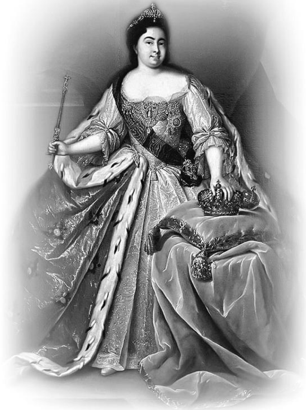
Неизвестный художник. Портрет Екатерины I, 2-я четверть XVIII века

• Имя Екатерина часто давалось царственным особам. Его носили две императрицы все-российские: Екатерина I и Екатерина II (Великая), ставшие Екатеринами при крещении. Княгиня Екатерина Дашкова и множество других знатных дам были также названы в честь святой Екатерины.