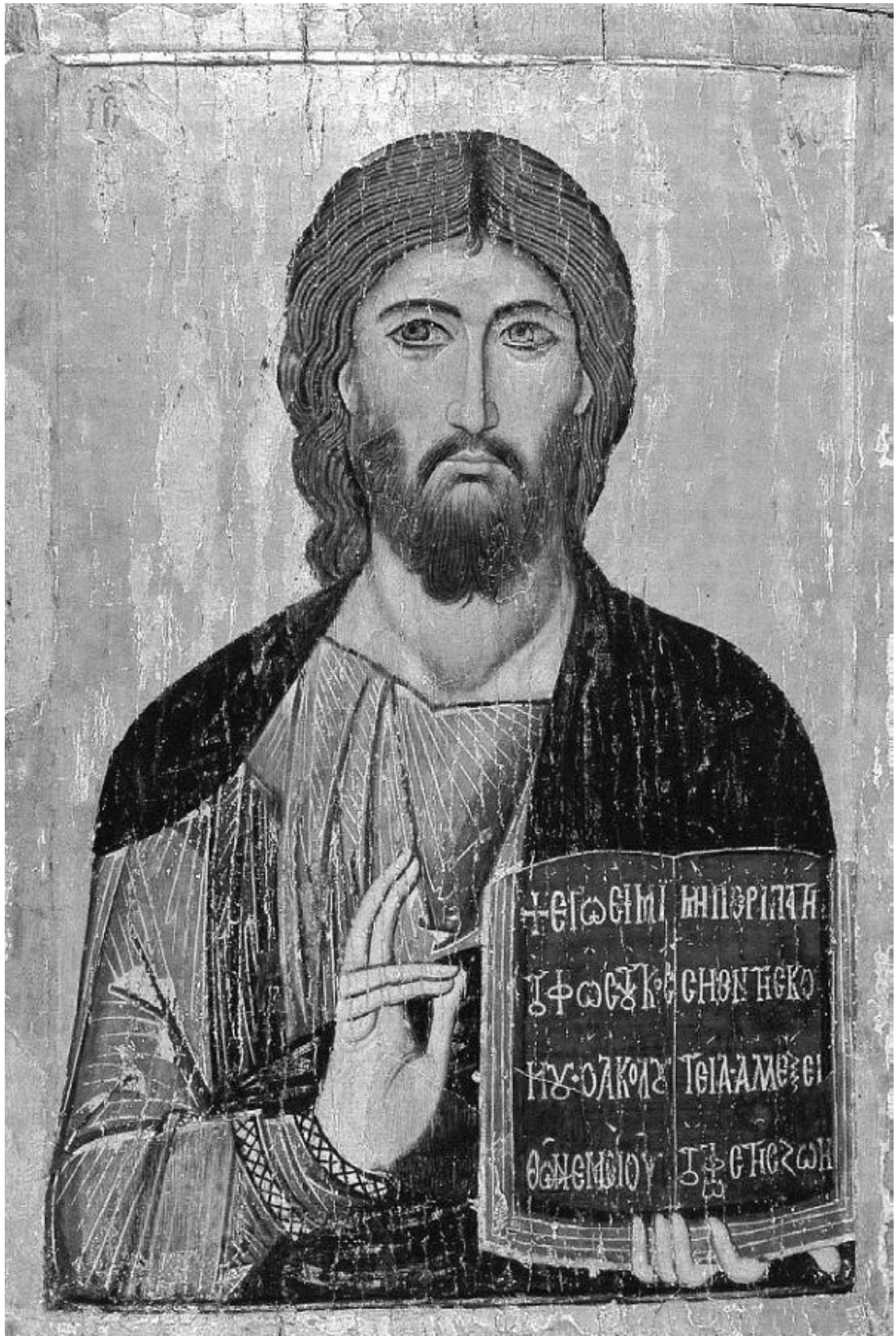
Икона из монастыря Святой Екатерины на Синае

– Господи, я долго ждала, пока моя девочка подрастёт и я смогу безбоязненно открыться ей – не отроковице, но взрослой девушке, которая поймёт счастье и вместе с тем опасность