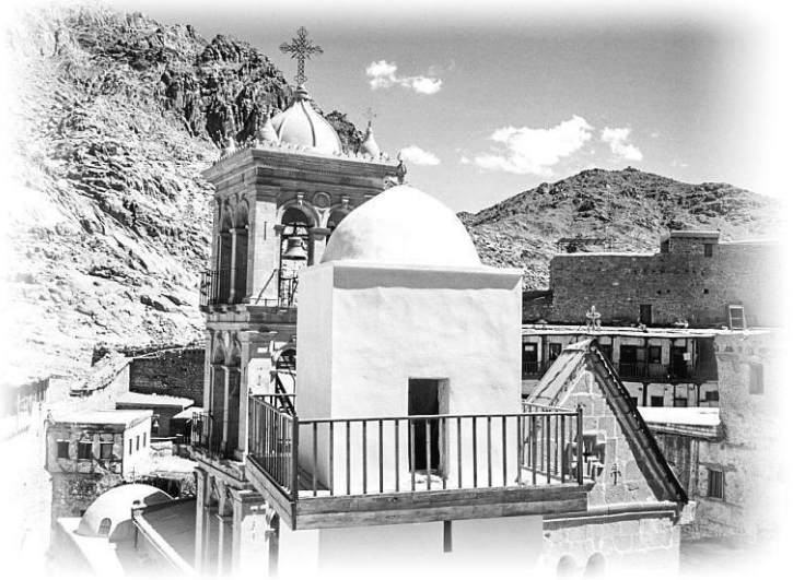
Монастырь Святой Екатерины на Синае

• Имя Екатерина широко распространено почти во всех странах и входит в десятку самых популярных женских имён.