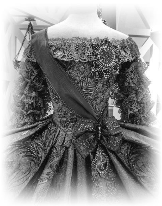
Свадебное платье великой княгини Екатерины Алексеевны (Екатерины II), 1745 год, с орденом Св. Екатерины