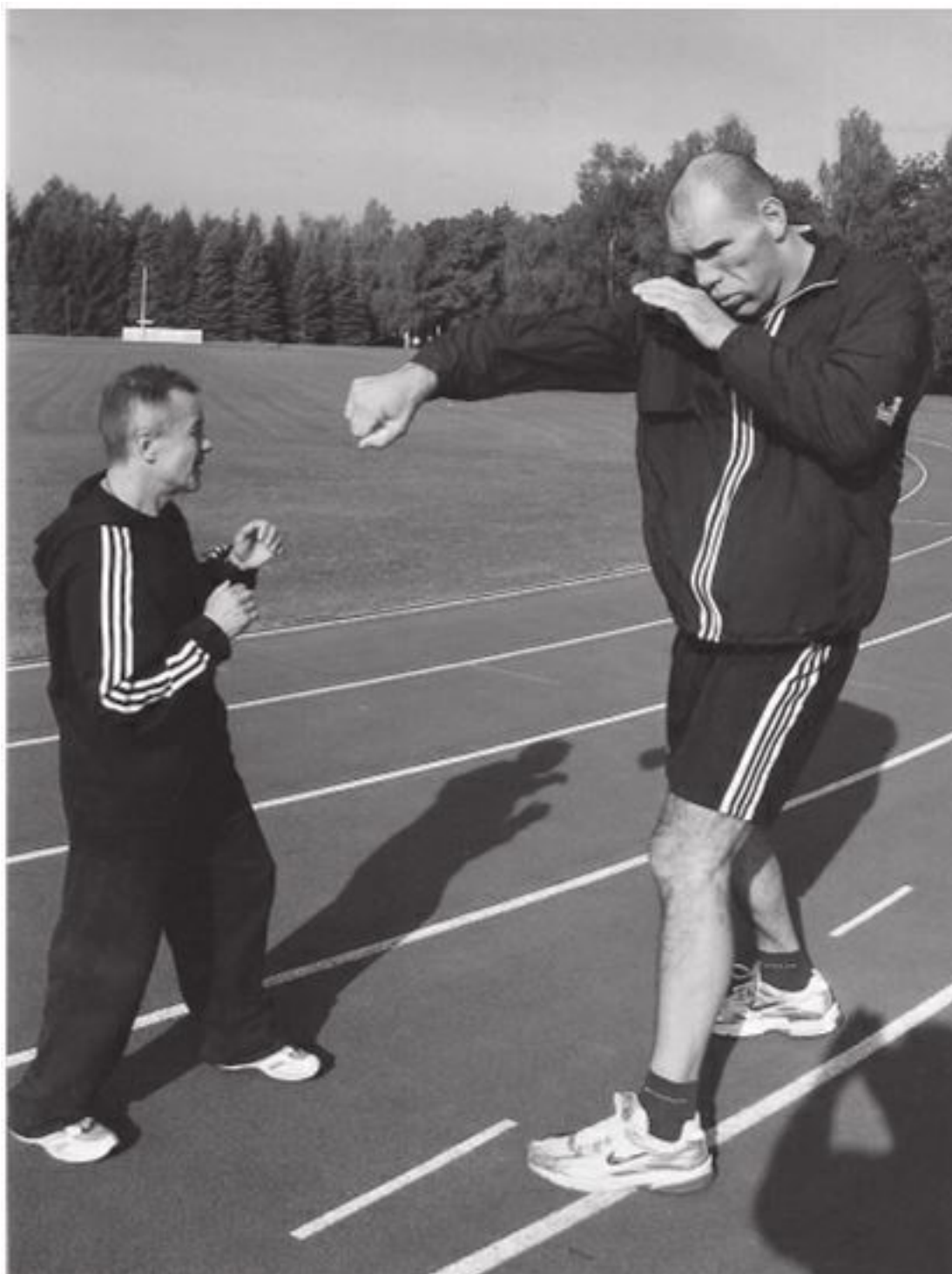
На утренней разминке

Помню, директор нашей школы без всякого повода с моей стороны как-то шутливо мне погрозил, мол, смотри, боксёр!