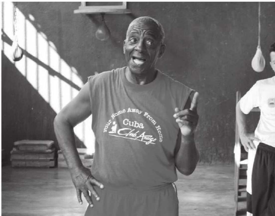
Великий кубинский тренер Альсидес Сагарра

ское государство, которое всегда стояло за Сагаррой, чьим личным другом был Фидель Кастро, не так давно ушедший из жизни, уже не поддерживает бокс так, как раньше.