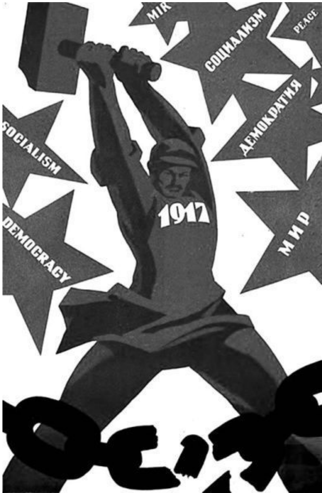
Плакат, посвященный Октябрьской социалистической революции

Уинстон Черчилль и другие представители британского правящего класса горячо восхищались Муссолини и Франко вплоть до 1939 года. По окончании Второй мировой войны «демократические» западные страны, прежде всего США, активно поддерживали каждую чудовищную диктатуру: от Сомосы до Пиночета, от аргентинской хунты до индонезийского мясника Сухарто, путь к власти которого при активной поддержке ЦРУ был устлан миллио-