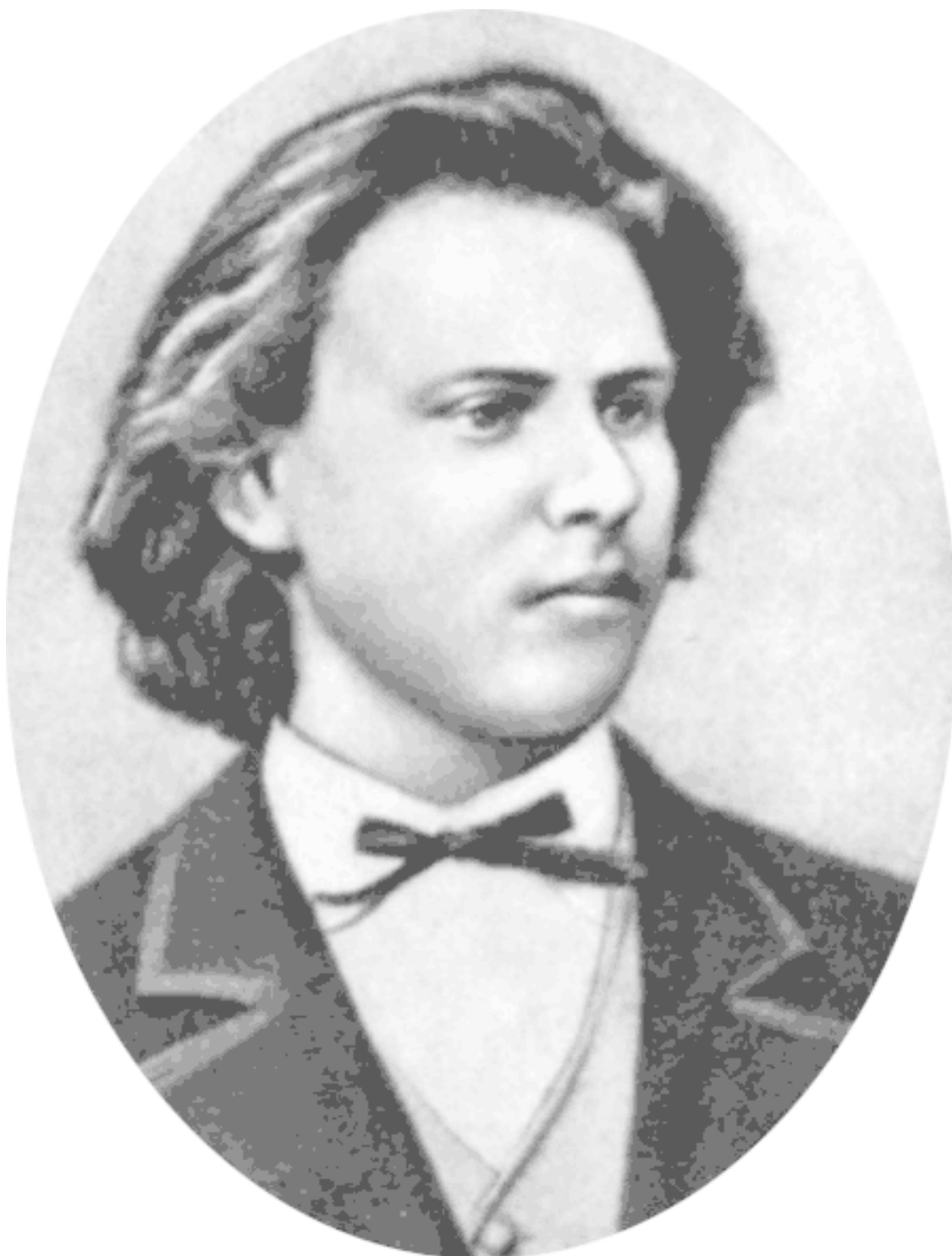
Андрей Желябов, один из руководителей «Народной воли»

Представления о партизанской борьбе и индивидуальном терроре, недавно ставшие модными в определённых кругах, в карикатурном виде повторяют устаревшие идеи российских народников и террористов. Подобно последним, они пытаются заручиться в странах третьего мира поддержкой крестьянства, люмпен-пролетариата – кого угодно, только не пролетариата. Такого рода идеи не имеют ничего общего с марксизмом. Маркс и Энгельс объясняли, что единственным классом, способным совершить социалистическую революцию и установить здоровое государство рабочих на пути к бесклассовому обществу, является рабочий класс. И это неслучайно. Только рабочий класс, в силу той роли, которую он играет в обществе и про-