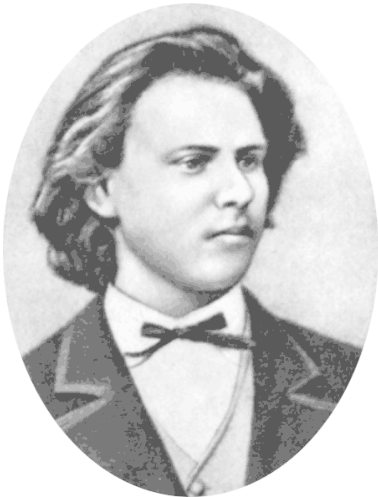
Андрей Желябов, один из руководителей «Народной во-