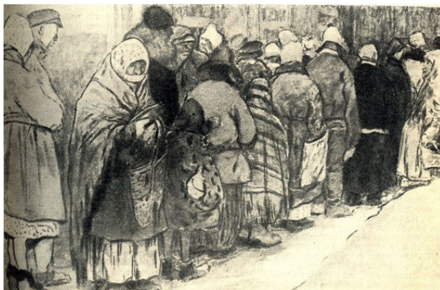
Ivan Vladimirov, In the Queue for Bread, First World War, 1914.

Как говорит песня —«История, та самая, которая ни слова, ни полслова не соврет».