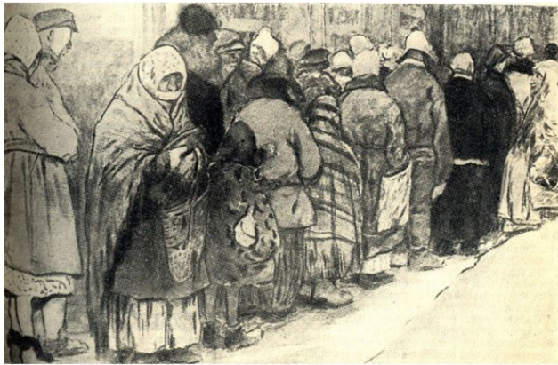
Ivan Vladimirov, In the Queue for Bread, First World War., 1914.