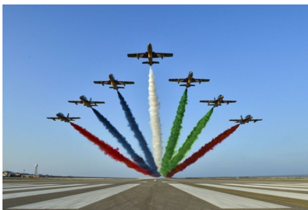
Взлет в Жуковском

Ежегодно, в подмосковном Жуковском, проводятся смотры, выставки, показы и авиа шоу с привлечением авиации всех типов, модификаций и назначений. Здесь представляются самые известные бренды нашей авиационной промышленности. Здесь вы увидите самолеты и вертолеты известных конструкторских бюро – Су, Миг, Ка, Ту. Например, истребители новейших поколений линейки Су и Миг, боевые бомбардировщики марки Ту, боевые и транспортные вертолеты линейки Ми, Ка. В выставочном комплексе можно ознакомиться с новейшими достижениями и в авиакосмической отрасли. Также посетители авиасалона смогут полюбоваться на групповой пилотаж «Русских витязей» на истребителях пятого поколения Су-30СМ. Часть полетов выполняют совместно пилотажная группа «Стрижи» и пилотажная группа «Русских витязей». Свою полетную программу показывает пилотажная группа «Соколы России». Цены на посещение авиасалона вполне умеренные. Дети до 14 лет, в сопровождении взрослых, посещают авиасалон бесплатно.