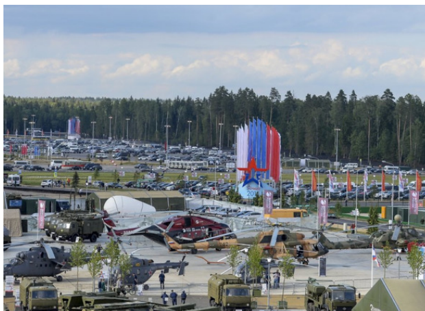
Музейный комплекс №1