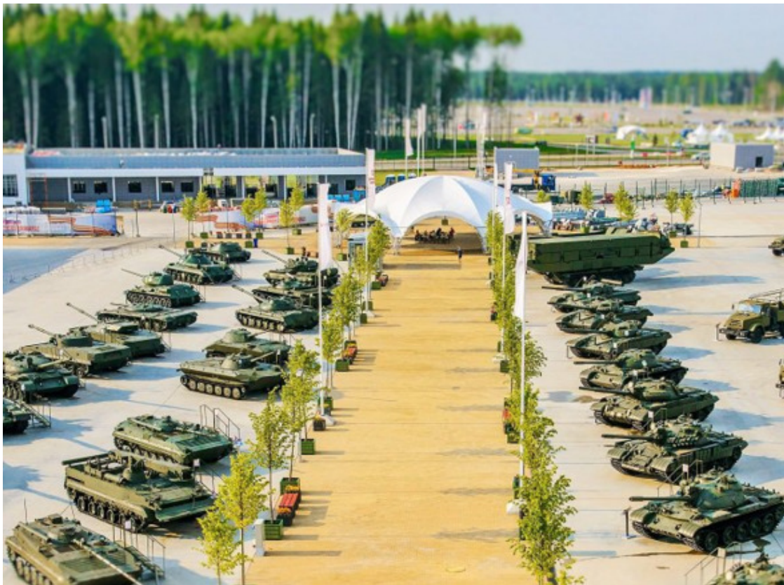
Музейный комплекс №2

Этот музей поистине национальное достояние страны. Имея богатейшую историю, этот музей известен во всем мире. Ранее он был самостоятельным музеем, а в настоящее время является филиалом парка «Патриот». Огромная экспозиция бронетанкового вооружения привлекает массы туристов с различных стран мира. Здесь представлены многие образцы эпохи танкостроения нашей страны и многих других стран. Имеются образцы танков от самого маленького до самого великого. Все можно смотреть, пробовать, обо всем можно спросить опытных экскурсоводов.