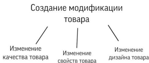
Рис.2 Создание модификации товара.

Когда у вас есть точное понимание того, кто ваш клиент, какими качествами он обладает, и какой продукт ему нужен, вы сразу поймёте, хорошо ли обстоят дела с производимым и предлагаемым вами товаром. Все недочёты будут видны сразу, вы увидите, чего не хватает в вашем предложении, а что, возможно, является избыточным. И вы сможете свой продукт подгонять, настраивать под конкретного клиента.