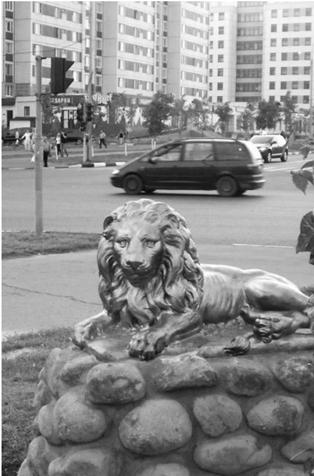
Лев в Жулебино

Здесь открылся «Паттерсон», Поликлиника, аптека, Есть «Авоська» и «Копейка». На столбах часы, реклама, Сквер – большая панорама. Вдоль аллея скамеек ряд,