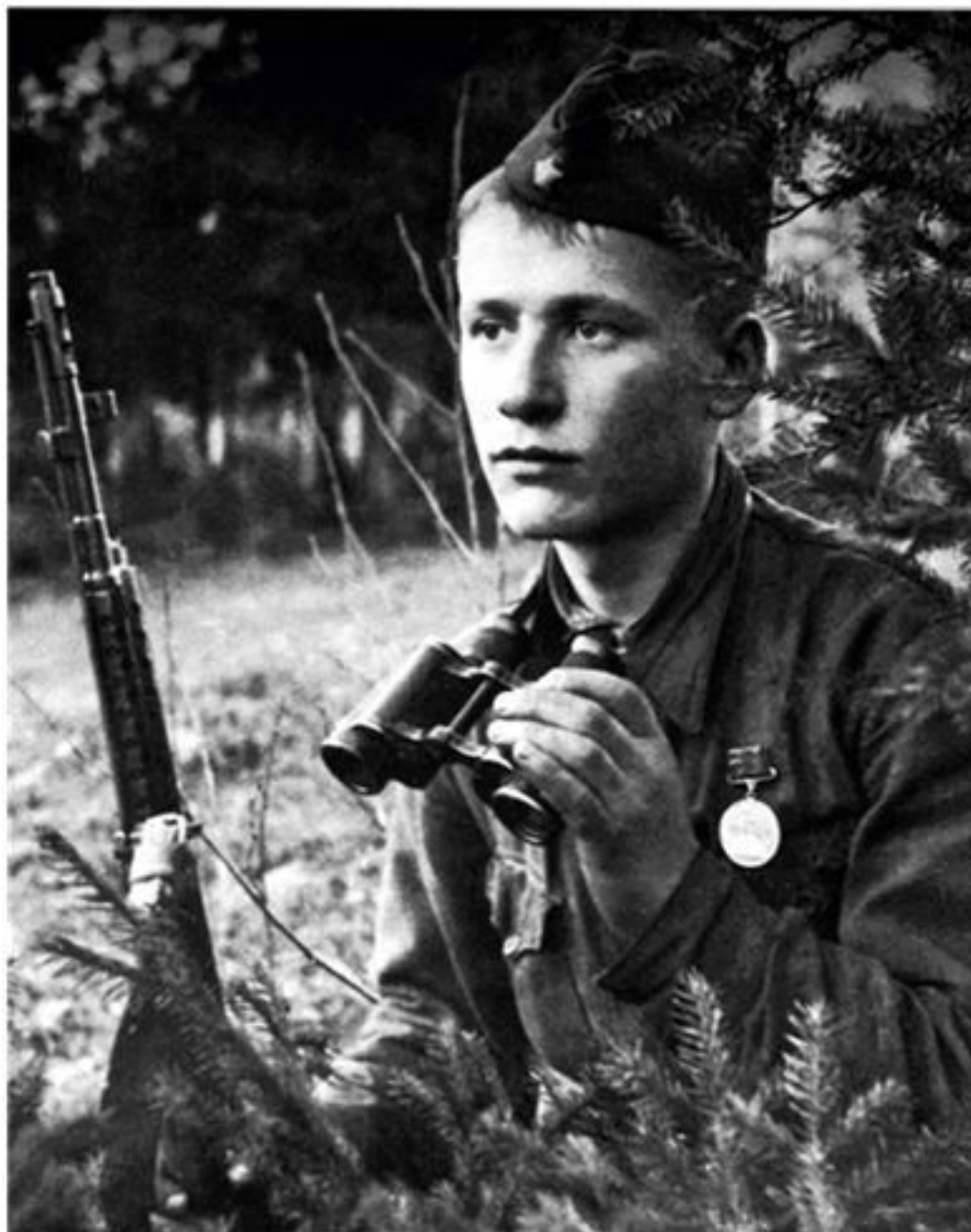
Фотография солдата Алёши, сделана фотографом Данишлом Онохиным. Из книги Н. Н. Никулина «Воспоминания о войне»

Погостье – железнодорожная станция Октябрьской железной дороги, расположенная на железнодорожной ветке Мга-Кириши (Ленинградская область). В период зимы 1941–1942 годов эта станция была отправной точкой для начала Любанской наступательной операции по прорыву блокады Ленинграда. С этой станции начали наступательные действия войска 54 армии с целью соединения с войсками 2 ударной армии Волховского фронта, чтобы в дальнейшем окружить Мгинско-Тосненскую группировку немецко-фашистских войск. Эти места отличались крайне тяжелыми боями, с огромными потерями. По оценкам архивов и участников тех событий, за неполных 3 месяца Красная армия потеряла здесь не менее 30–50 тысяч солдат. По оценкам некоторых специалистов, эта цифра гораздо больше. Останки этих бойцов до сих пор лежат в этих труднодоступных местах, по полям и оврагам, в болотах и низинах. Земля в этих местах буквально искорежена металлом, поисковые группы до сих пор находят