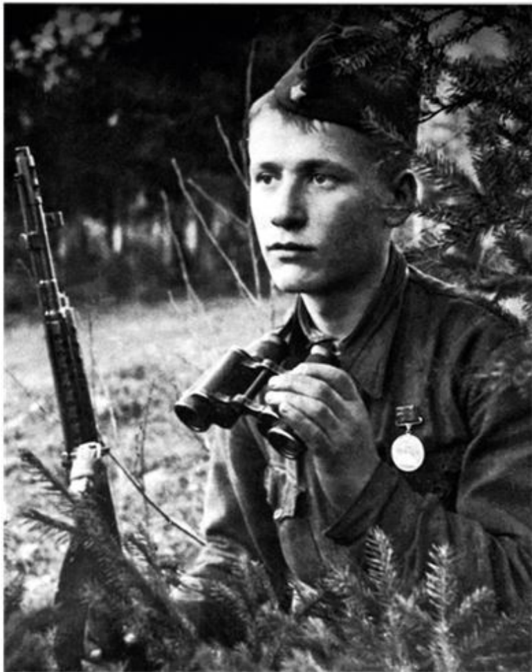
Фотография солдата Алёши, сделана фотографом Данилом Онохиным. Из книги Н. Н. Никулина «Воспоминания