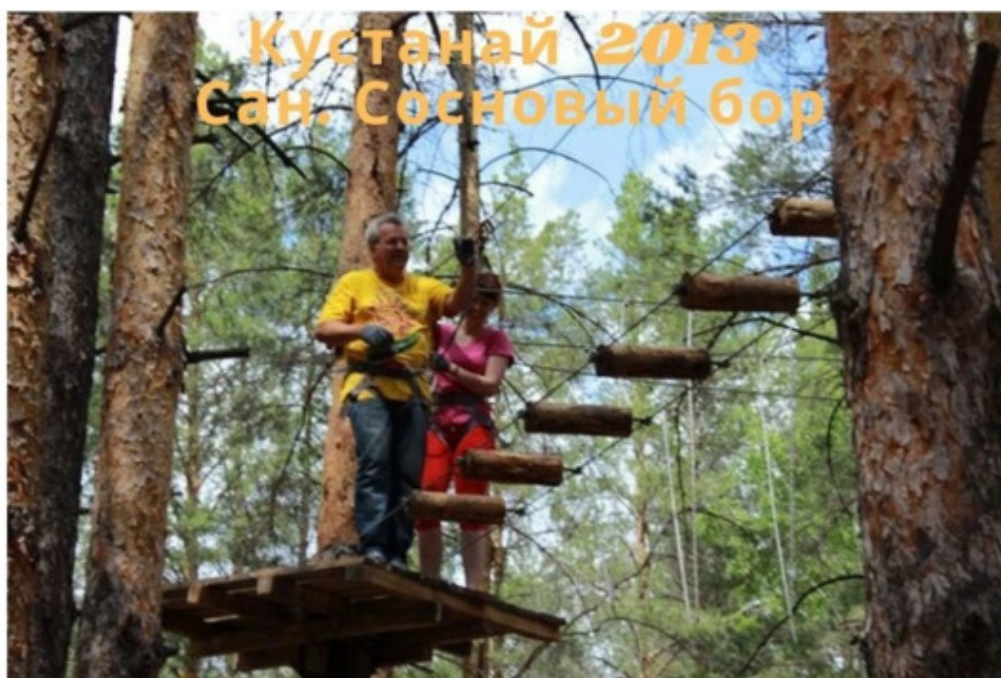
Хороший санаторий. Рекомендую.

Кустанай – светлые воспоминания об отдыхе в Санатории Сосновый бор. 2013г.