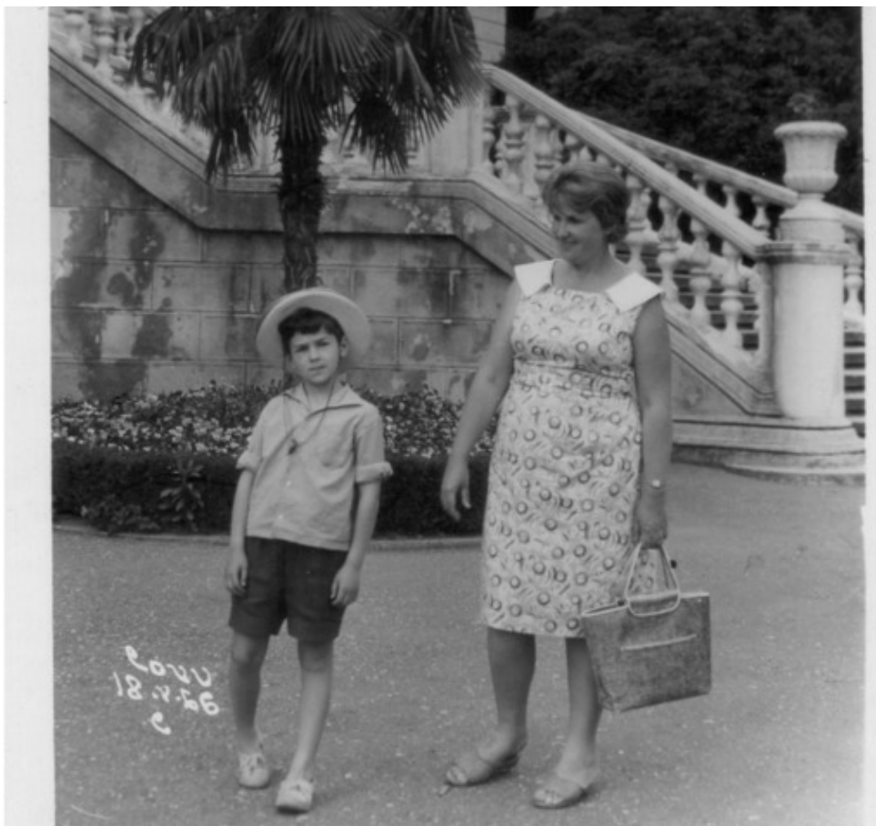
Я и мама в Сочи 1966г.

А затем вновь «Абхазия», полное воссоединение семьи и Москва. И уж потом к деду в Грязи. А еще через месяц Москва и самолетом, через Красноярск (где тоже остановились почти на месяц) домой на Камчатку.