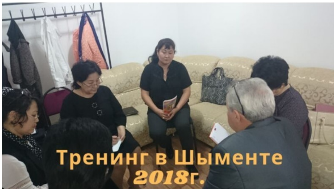
Тренинг финансовых консультантов.

Усть-Каменогорск – 1993—1995. Проживал с семьей. Создавал «бизнес с нуля». Результат – трехкомнатная квартира в новом доме возле старого У-К вокзала. С 1995 по н.в. неоднократные командировки по службе, а также поездки к родственникам. Проведение тренингов.