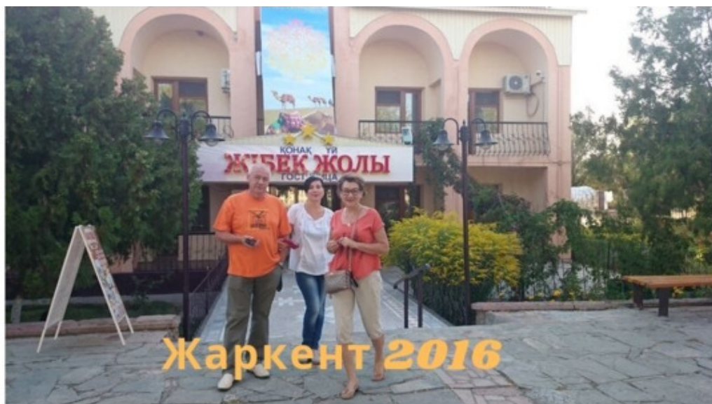
Поездка на МЦПС «Хоргос»

Жаркент – 2016 по н.в. поездки в Хоргос.