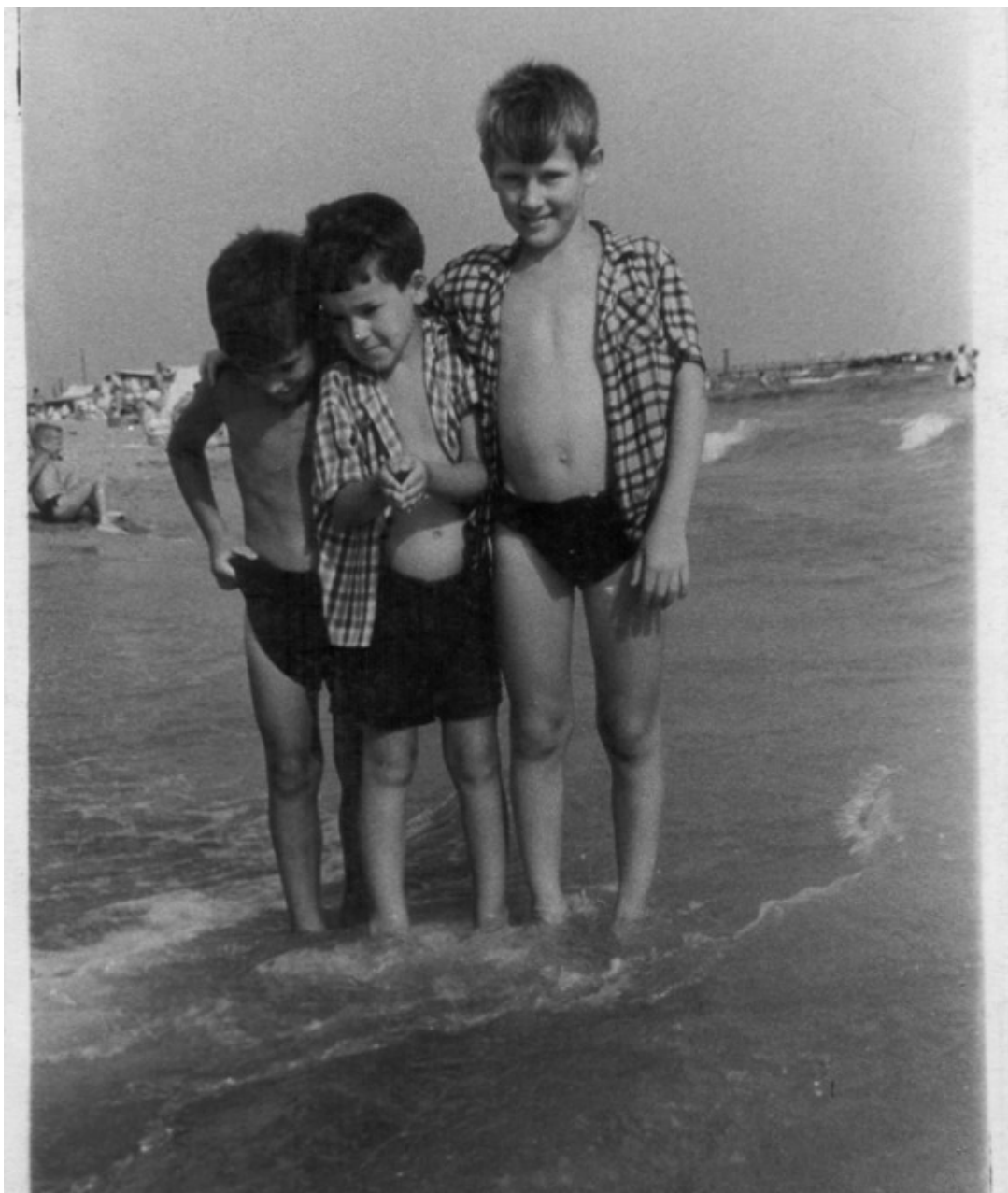
Я и братья в Сочи 1963г.

А в 1966 мы уже летели на самолете. Из Питера в Москву и далее в Симферополь. Везли моего старшего брата в Артек на целый месяц. А мы с мамой из Ялты на теплоходе «Абхазия» совершили переход в Сочи, отдыхать в Красной поляне, где позже к нам присоединился отец.