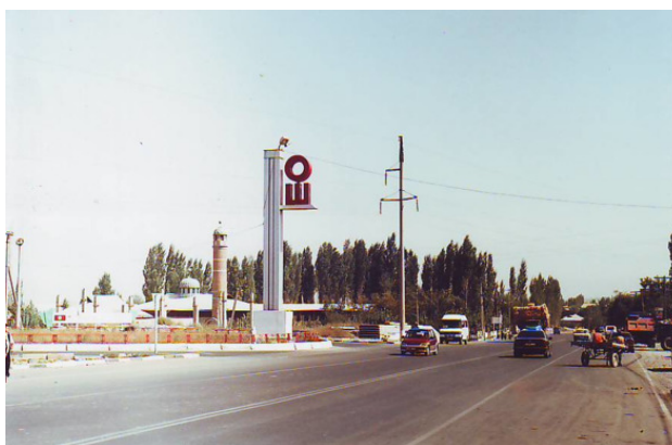
Въезд в Ош

Осенью 2006 года подошёл к завершению проект «Дом АВП в Иркутске». Завершая эту четырёхмесячную эпоху жизни – о ней подробно написано в отдельной повести – я задумался о том, где бы ещё, в каком бы ещё интересном месте, прожить лето-2007. Не удивительно, что таким городом для жизни и для организации нового Дома Для Всех я выбрал Ош – крупный город на юге Киргизии, в Ферганской долине, один из приятнейших городов Средней Азии, в котором я до этого неоднократно бывал раньше, начиная с 1999 года.