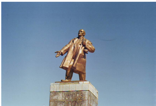
Ленин в Исфаре

Исфара – таджикский приграничный городок – оказался крупным, не то что селение Баткен. Удивило то, что 99% женщин было одето «по форме» – в мусульманском виде. В Ошской и Баткенской областях таких было не более 75%. Всюду в Исфаре – торговля, менялы денег, еда вкуснейшая. Тут же нас позвали в гости, но мы отказались из-за раннего часа. В.И. Ленин очень смешной, в виде памятника, такой бодрый, топает ногами вперед, а телом назад наклонился.