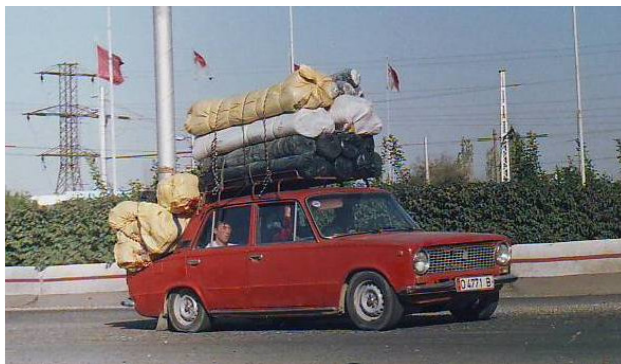
Машины в окрестностях Кара-Суу