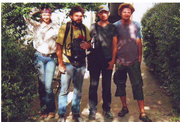
У подъезда Дома

Общая площадь квартиры – не меньше 50 кв. метров. Завесили стены фотографиями, картами и инструкциями для гостей – получился вполне жилой Дом АВП.