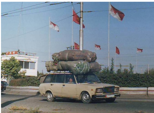
Все такие нагруженные, на рынок