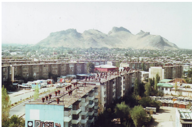
Вид города Ош и Сулейман-горы

В Оше первым делом мы пошли искать обычный цивилизный ночлег на какой-нибудь турбазе. Потому, что единственный активный ошский человек из Клуба гостеприимства, 50-летний бывший милиционер, не отвечал на наши звонки – уехал на заработки в неизвестном направлении. Однажды, получив мой Емайл, он сам позвонил: оказалось, он сейчас работает в южном Судане, в городе Малакаль, в составе миротворческих сил.