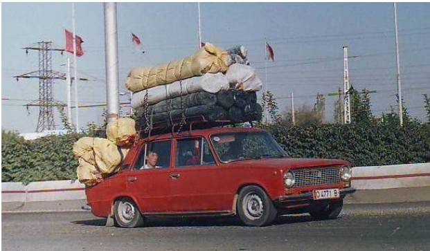
Машины в окрестностях Кара-Суу