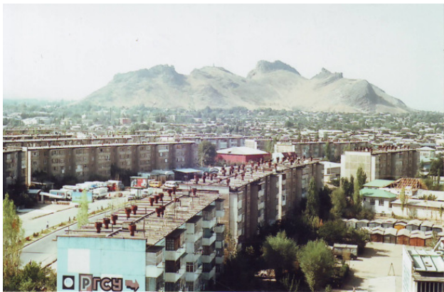
Вид города Ош и Сулейман-горы

В Оше первым делом мы пошли искать обычный гражданский ночлег на какой-нибудь турбазе. Потому, что единственный активный ошский человек из Клуба гостеприимства, 50-летний бывший милиционер, не отвечал на наши звонки – уехал на заработки в неизвестном направлении. Однажды, получив мой Емайл, он сам позвонил: оказалось, он сейчас работает в южном Судане, в городе Малакаль, в составе миротворческих сил.