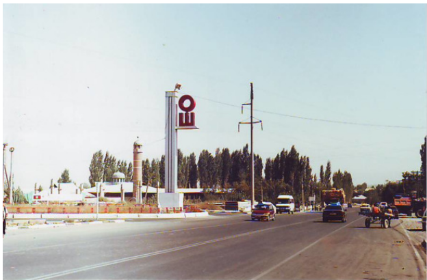
Въезд в Ош

думался о том, где бы ещё, в каком бы ещё интересном месте, прожить лето-2007. Не удивительно, что таким городом для жизни и для организации нового Дома Для Всех я выбрал Ош – крупный город на юге Киргизии, в Ферганской долине, один из приятнейших городов Средней Азии, в котором я до этого неоднократно бывал раньше, начиная с 1999 года.