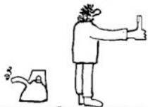
ЖЕСТЫ: 1) НИЩЕГО; 2) ПУТЕШЕСТВЕННИКА; 3) ПРИМЕНЯЕМЫЙ НА ЗАПАДЕ.

Голосуйте, как вам нравится. Но не стойте «вполоборота», повернувшись к водителям боком или спиной. Также, нельзя голосовать с мыслью: «Ну, этот точно не остановится, на всякий случай подниму руку...» Не рассеивайте внимание, а поднимайте руку, напротив, с уверенностью в успехе. Если нет уверенности в успехе – лучше пропустить машину-другую, съесть конфетку.