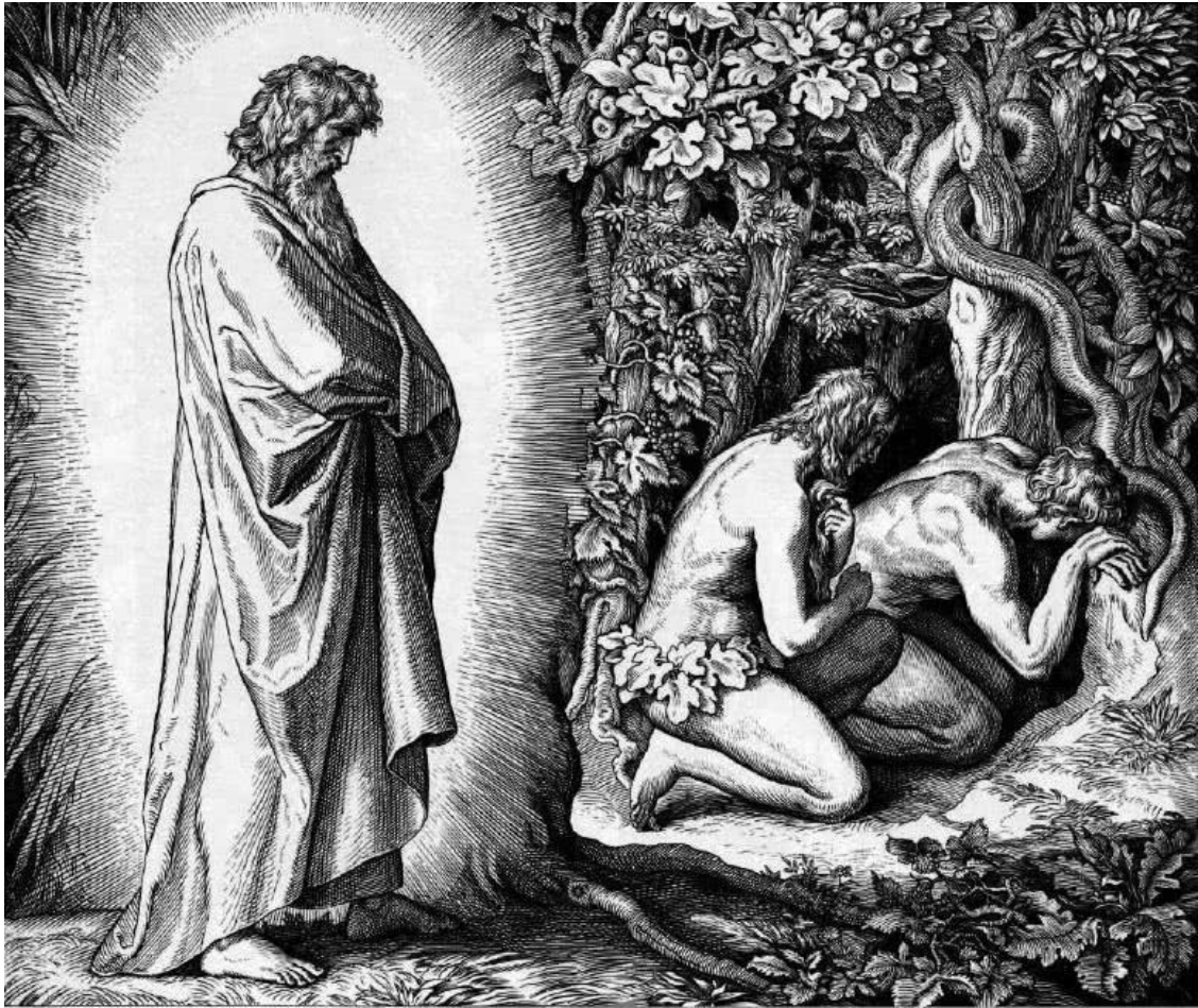
Адам и Ева скрываются от лица Господа. Художник Ю. Ш. фон Карольсфельд (1794–1872)

Сюжет Библии известен каждому, кто хотя бы немного знаком с христианской культурой. Бог создал Адама и Еву и поселил в раю, наказав: «...плодитесь и размножьтесь...» (Бт. 1:28). Оба были наги, но не стыдились этого. Однако при этом настрого запретил им есть яблоко с Древа познания добра и зла. Но тут им повстречался змей, который убедил Еву, что ничего страшного не будет. Она и сама съела, и Адама угостила. «И открылись глаза у них обоих, и узнали они, что наги, и сшили смоковые листья, и сделали себе опоясания» (Бт. 3:7). Разгневанный Бог сказал Еве: «...умножая умножу скорбь твою в беременности твоей; в болезни будешь рождать детей; и к мужу твоему влечение твое, и он будет господствовать над тобою», – и выслал грешников из сада Эдемского (Бт. 3:16).