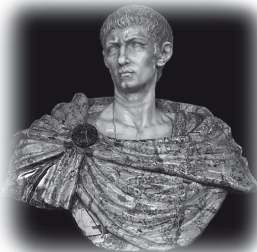
Бюст императора Диоклетиана

Некоторое время спустя святитель Николай попал в город Миры, столицу Ликии, где его никто не знал. Он жил в бедности и подвизался в молитве, ежедневно посещая церковь. В это же время в Мирах скончался архиепископ и собор епископов пытался избрать нового архипастыря.