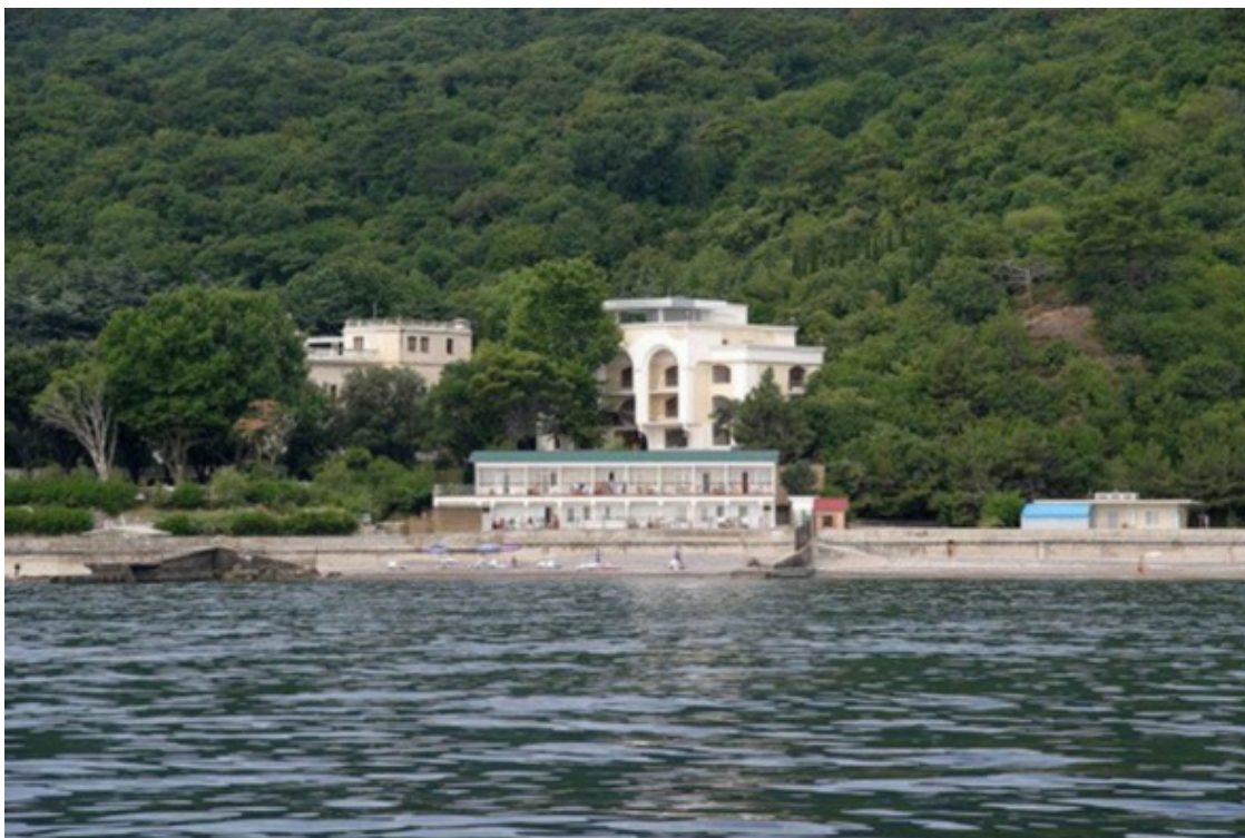
Дача «Глициния». Крым. Буклет

вались потом моряки, распаковывавшие ящики с ракетами из Советского Союза. В Турции тестировали аппаратуру пуска и наведения американских ракет, редактировали списки обречённых на ядерные удары городов.