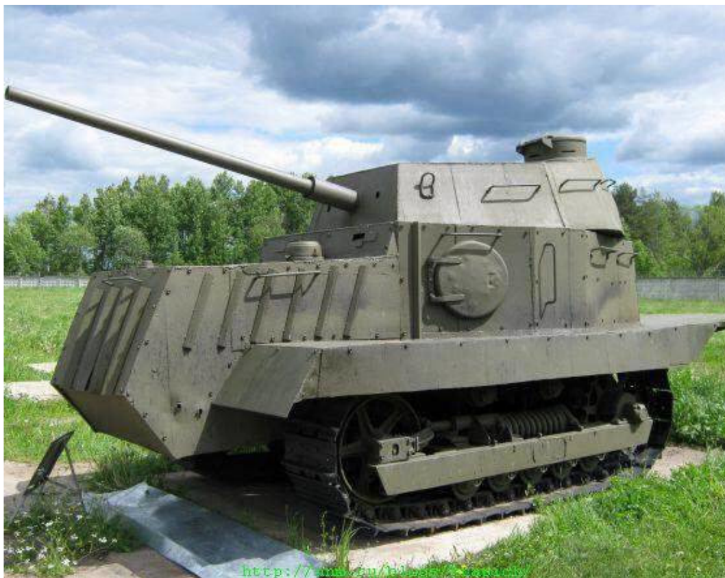
Самодельный защитник Одессы/ Буклет