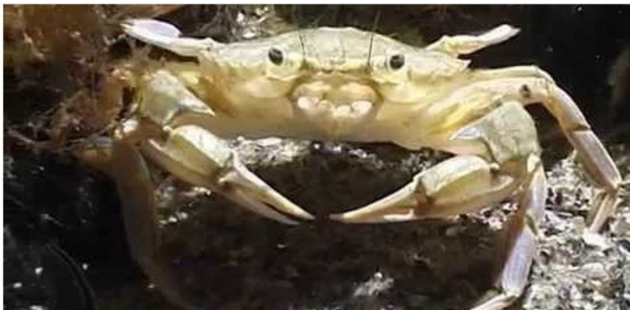
Краб ПЕСЧАНИК, ПЛАВУНЕЦ, FREE INTERNET