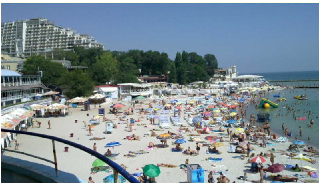
Аркадия. Одесса. Буклет