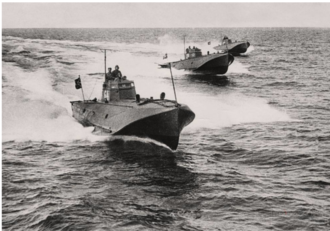
Торпедные катера проекта Г-5.

Особенно на «авиационных» катерах, в основе конструкции которых был поплавок гидросамолета. Вместо верхней палубы у проектов «Ш-4» и «Г-5» была круто изогнутая выпуклая поверхность. Обеспечивая прочность корпуса, она в то же время создавала массу неудобств в обслуживании. На ней трудно было удержаться даже тогда, когда катер был неподвижен. Если же он шел полным ходом, сдувало решительно все и всех. Это оказалось очень большим минусом во время боевых действий: десантников приходилось сажать в желоба торпедных аппаратов – размещать их больше было негде. Дюраль корпуса в морской воде подвергался коррозии. Приходилось периодически вытаскивать катер на сушу и натирать специальным составом, как паркетные полы, только чаще.