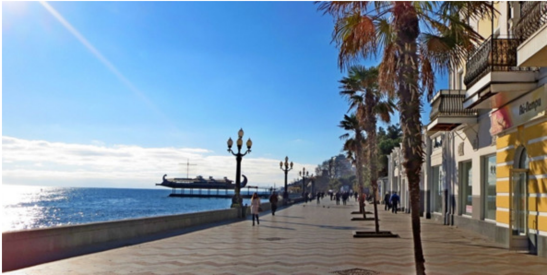
Ялта. Набережная. Буклет

На Ялту надвинулась угроза массовых беспорядков, со всех концов сбегались местные, включая барменов, шоферов и милиционеров. С приходом к морякам подкрепления – ещё одного катера с десантом, угроза превратилась в реальное побоище. Была поднята по тревоге ближайшая воинская часть, прибывшая с автоматами без патронов, раскалились от армейских и флотских выражений телефонные провода, кто-то доложил и на дачу в Ливадии, лично тогдашнему Главкому Вооруженных Сил СССР. Вернувшись в Москву через неделю, он вызвал Капитана в Кремль.