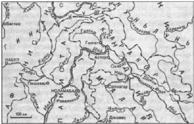
- - - Государственные границы - - - Демаркационная линия между Индией и Пакистаном в Кашмире ИСЛАМАБАД Столицы государств Равалпинди Прочие населенные пункты ..... Маршруты Мишеля Бесселя