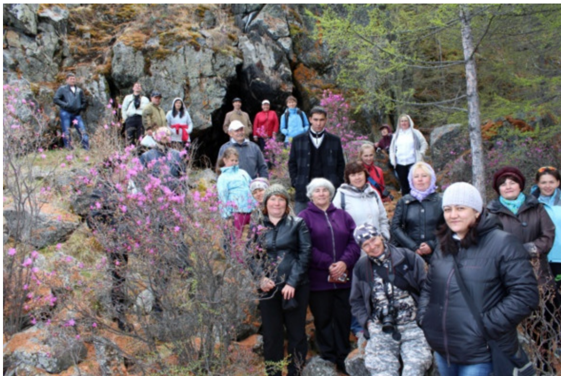
Туристы на Байкале