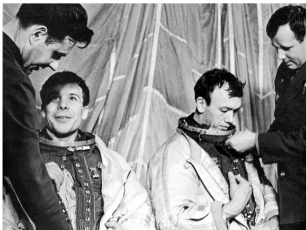
Рис. 2. Комаров и Гагарин помогают со скафандрами Хрунову и Елисееву