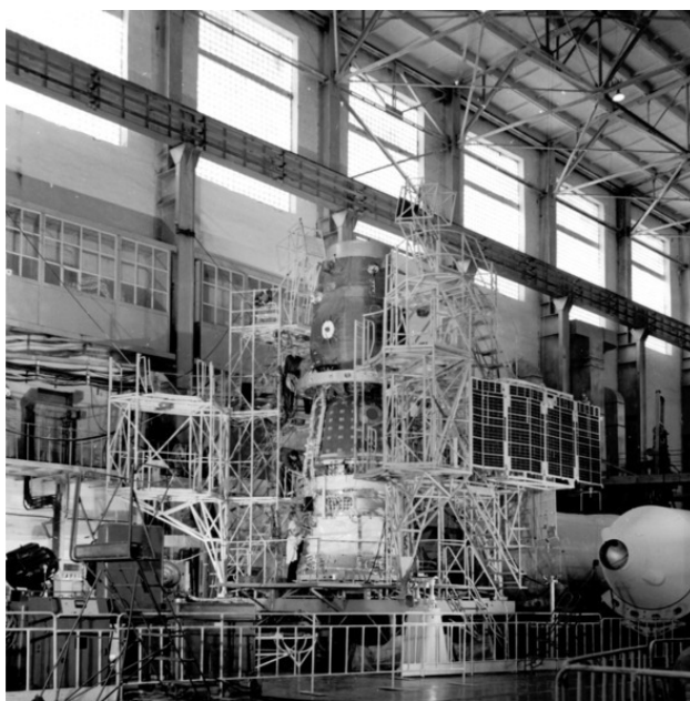
Рис. 5. Один из ранних кораблей типа «Союз»

Единственное, что насторожило, – странные колебания корабля. Но аппарат вышел из зоны видимости советских измерительных пунктов, и понять, что случилось, было нельзя. А на космодроме тем временем стали готовить 7К-ОК №1.