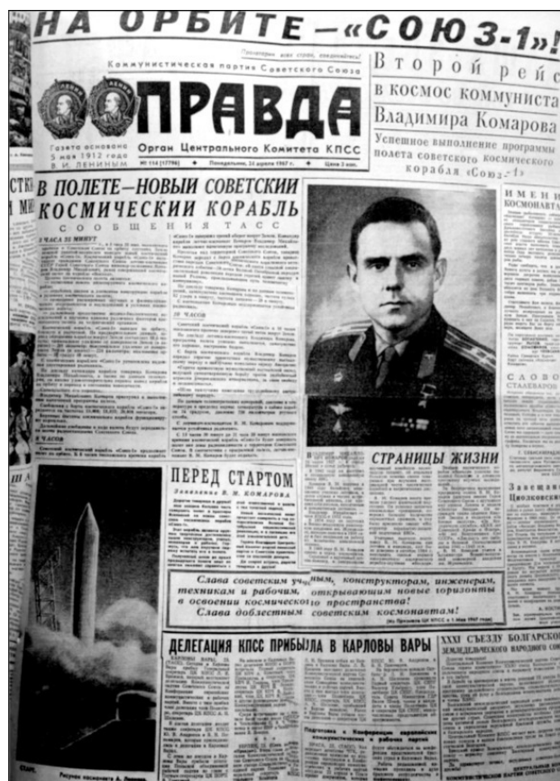
Рис. 1. Газета «Правда» от 24 апреля 1967 года