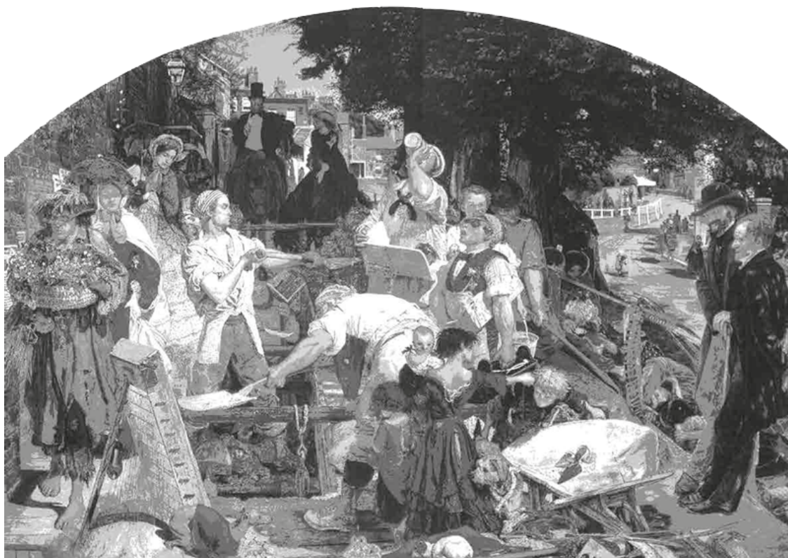
Форд Мэддокс Браун. Труд. 1852—1865

О. В. Разумовская «Верховный жрец викторианского общества»: Рёскин и его время