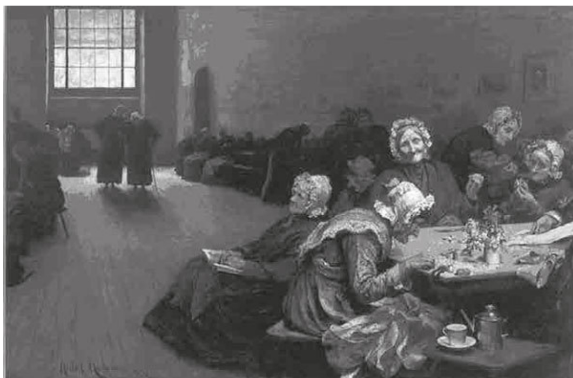
Губерт фон Геркоммер. Вечерний час в работном доме