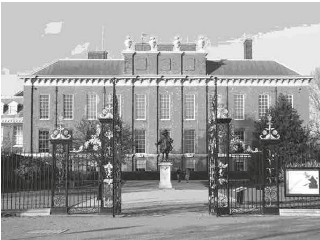
Кенсингтонский дворец, в котором родилась и провела свое детство Виктория

Однако путь юной принцессы к трону оказался отнюдь не гладким, и основные препятствия на этом пути возникали благодаря интригам и амбициям ее родственников и ближайшего окружения. Девочке приходилось играть роль буфера между ее матерью – вдовствующей герцогиней – и дядей, королем Англии. Кроме того, Эдвард оставил после себя огромные долги, и первые годы Виктории прошли в спартанских условиях по причине стесненного материального положения ее матери. Вдовствующая герцогиня была вынуждена полагаться на великодушие своего деверя, короля Уильяма IV, который не жаловал свою немецкую родственницу. Герцогиня Кентская полагала, что Виктория не сможет справиться с предстоящей ей великой миссией без мудрого материнского руководства и неусыпного контроля. Она рассчитывала превратить юную принцессу в свою послушную марионетку, добившись регентства и участия во всех придворных и государственных делах. Ирония ситуации заключалась в том, что мать Виктории сама была марионеткой в руках амбициозного и расчетливого временщика – Джона Конроя 10 .