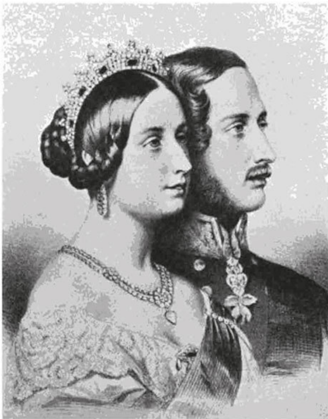
Королева Виктория и принц Альберт

Возможно, Альберт и был ангелом – по крайней мере, в глазах Виктории и рисовавших его придворных портретистов, – однако перед болезнями он был уязвим, как простой смертный. В 1861 году он скоропостижно скончался от тифа, оставив королеву безутешной до конца ее дней. Виктория горевала так же неистово, как и любила. На протяжении нескольких лет после смерти мужа она отказывалась появляться на людях и выполнять свои монаршие обязанности. В течение сорока лет вдовства она носила траур; по ее приказу в комнаты Альберта ежедневно приносили свежее белье, полотенца, горячую воду, накрывали для него стол к обеду.