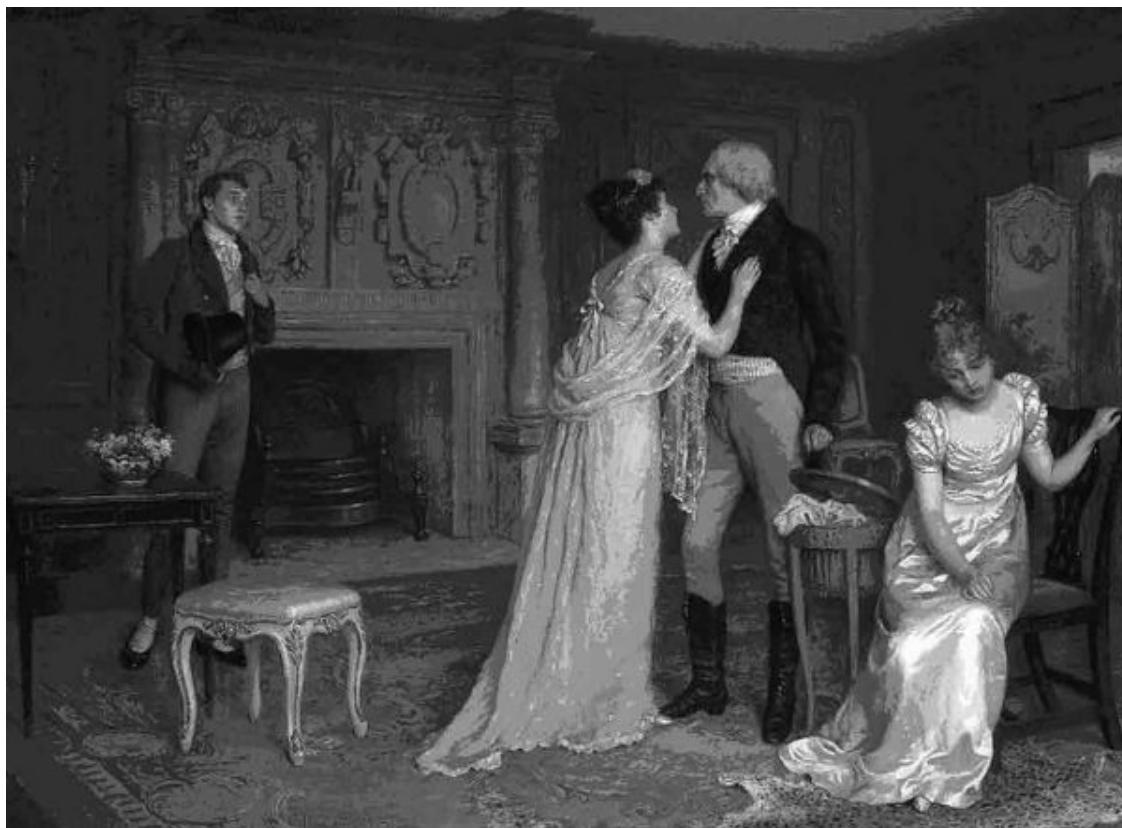
Чарльз Хэй Вуд. Любовь победит (Разгневанный отец). 1900

В то время как Виктория сама сделала предложение своему будущему супругу, молодой англичанке из приличной семьи запрещалось проявлять малейшую инициативу в общении с мужчиной и как-либо демонстрировать свой интерес к противоположному полу. Виктория и Альберт были ровесниками, и их объединяли общие интересы и увлечения – музыка, книги, верховые прогулки, проекты социальных и политических реформ в стране. В это же время большинство английских невест, несмотря на юный возраст, получало в супруги мужчин значительно старше себя (нередко вдовцов с детьми), имеющих обширный жизненный опыт и не интересующихся мнением или увлечениями своей «дражайшей половины». За плечами у немолодых женихов часто оказывался значительный «багаж» сексуальных контактов, который вместе с венерическими заболеваниями, невежеством и предрассудками касательно половых отношений становился «стартовым капиталом» супружеских отношений 22 . Результатом этого прискорбного «вклада» в семейную жизнь были бесплодные браки или рождение больных детей, отчуждение супругов, измены, распавшиеся союзы, поломанные судьбы.