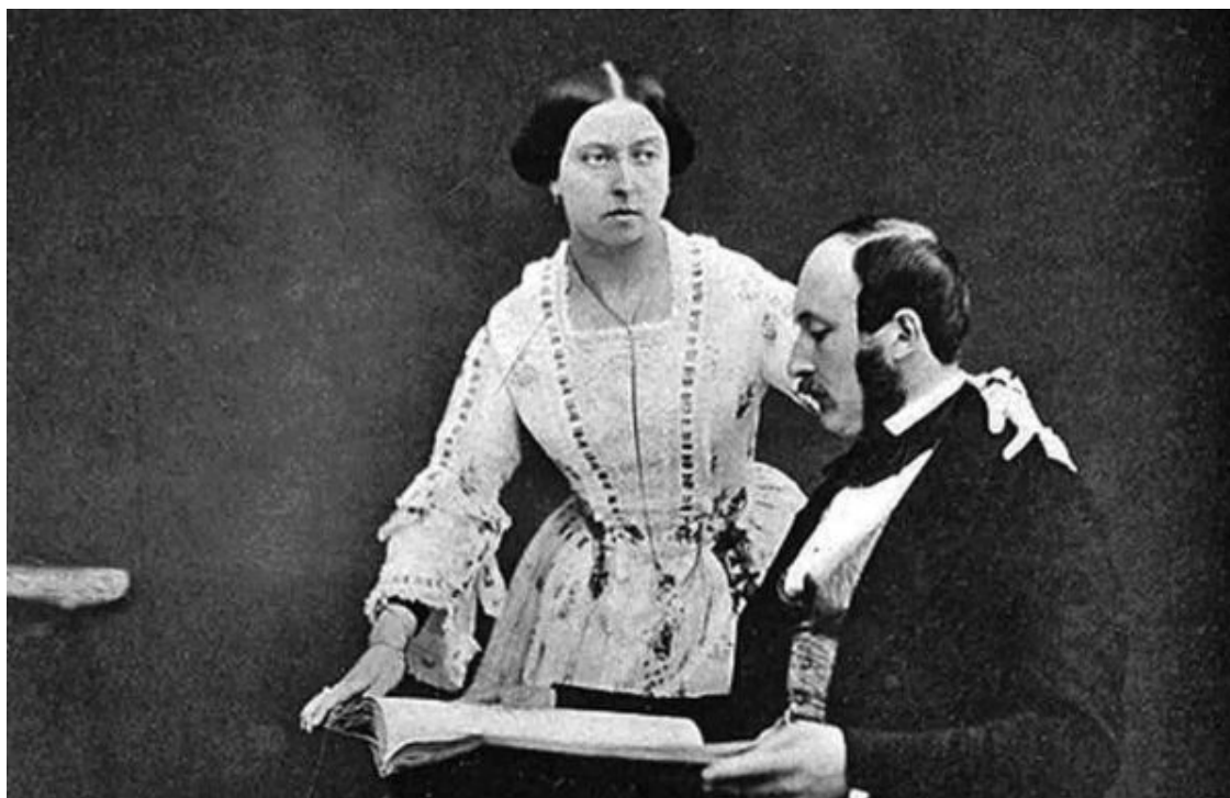
Виктория с принцем Альбертом. ок. 1854

либо за выносливость и функциональность (в низшем). Даже королеве не удавалось забыть об этом распределении ролей. Биографы упоминают одну из крупных ссор Альберта и Виктории, после которой принц закрылся в своей комнате и не открывал на стук супруги, пока она не ответила на его вопрос «кто стучит?» смиренным «твоя жена» вместо привычного ей горделивого «королева Англии». Несмотря на то что корону носила из них двоих только она, да и вообще это был ЕЕ дворец и ЕЕ страна, она была в первую очередь замужней женщиной, которая должна всегда уступать супругу.