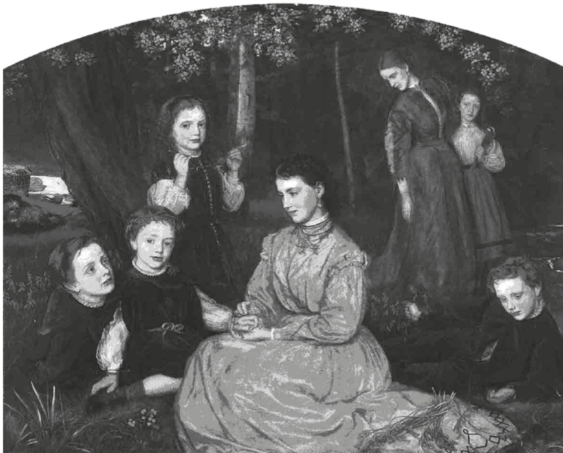
Артур Хьюз. Пикник в день рождения

Еще одним расхождением королевы Виктории с «ангельским» образом было ее влечение к супругу, даже некоторая одержимость его физической привлекательностью и стремление получать от супружеских отношений плотское удовольствие, о чем она весьма откровенно рассказывала в письмах и дневниках. Рядовой викторианской леди, не наделенной королевскими привилегиями, было запрещено выражать и демонстрировать чувственные порывы (а по сути, даже испытывать их). Ханжеские моральные установки этого времени требовали от женщины невозможного: она должна была исправно осуществлять свою репродуктивную функцию 28 , сохраняя при этом чистоту и наивность в вопросах пола. В результате таких противоречивых требований лондонские врачи сталкивались с трагикомическими по своей сути случаями, когда будущая мать не знала, каким образом ее ребенок должен появиться на свет.