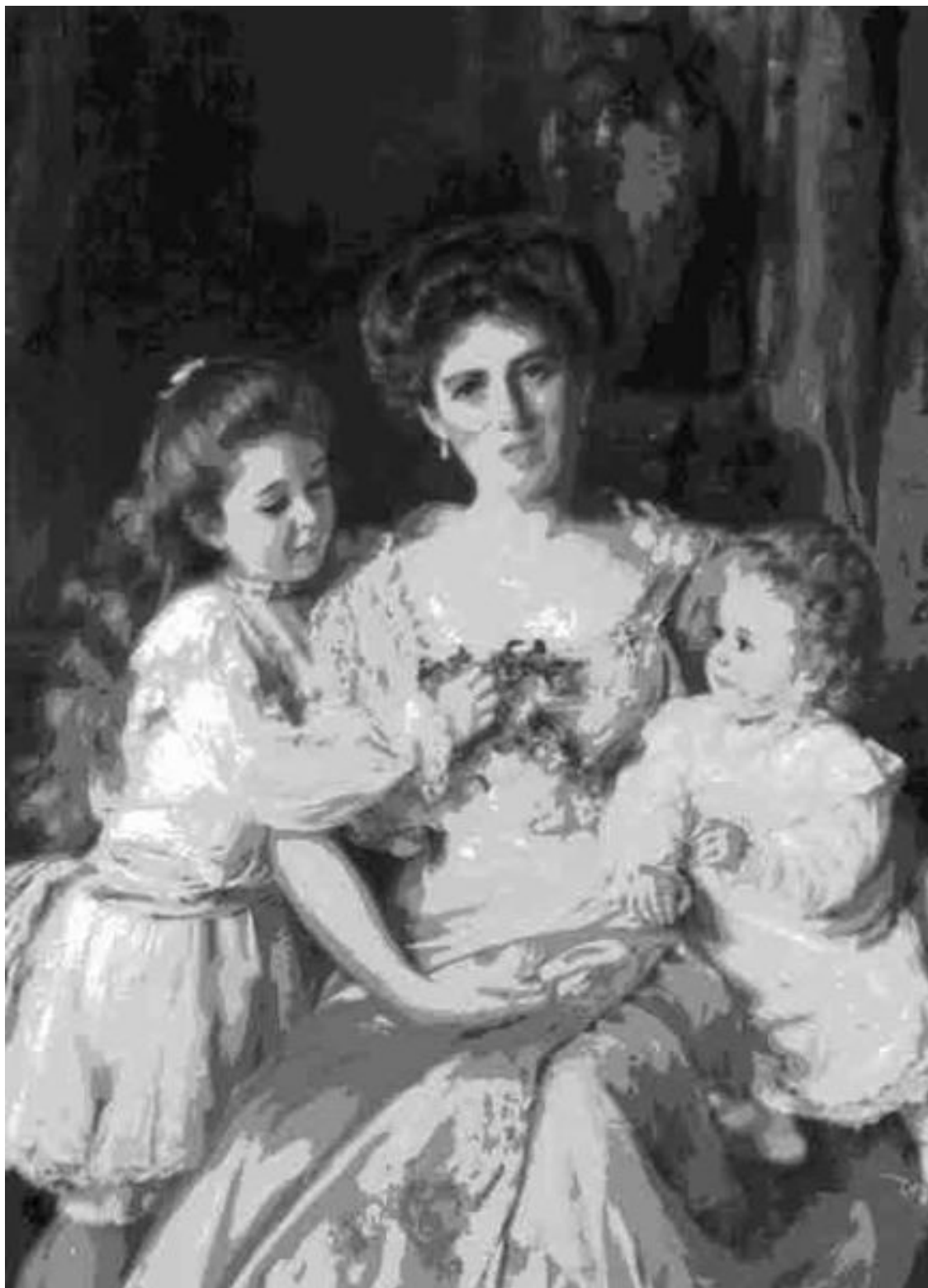
Томас Кеннингтон. Материнская любовь

Материнство как главное предназначение женщины прославлялось и идеализировалось в викторианском искусстве; некоторые художники специализировались на изображении сентиментальных семейных сценок, в то время как трудности и риски репродуктивной деятельности игнорировались или замалчивались 29 . Хотя в викторианской леди приветствовались