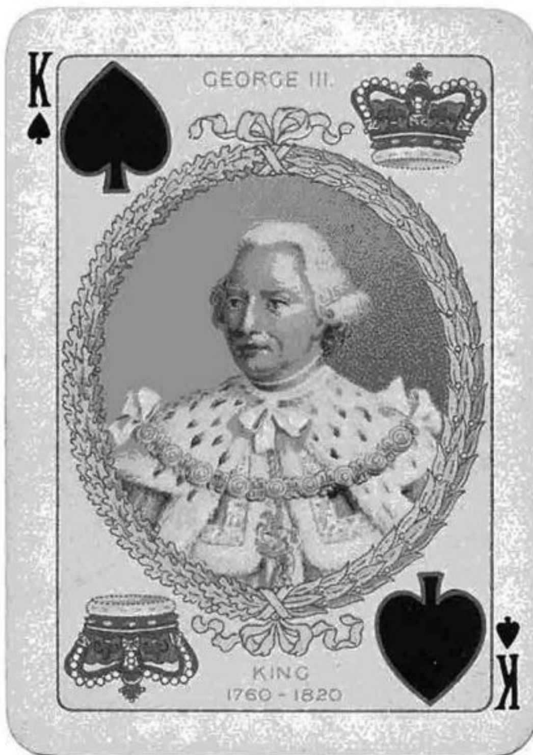
Игральная карта с портретом Георга III

Помимо своего заболевания, дед Виктории был знаменит своей плодовитостью. В отличие от своих предшественников – деда, отца и дяди, не скрывавших своих многочисленных любовниц и внебрачных отпрысков, – Георг III был известен как примерный супруг и нежный, заботливый отец. Супруга Шарлотта подарила ему пятнадцать детей, из которых тринадцать