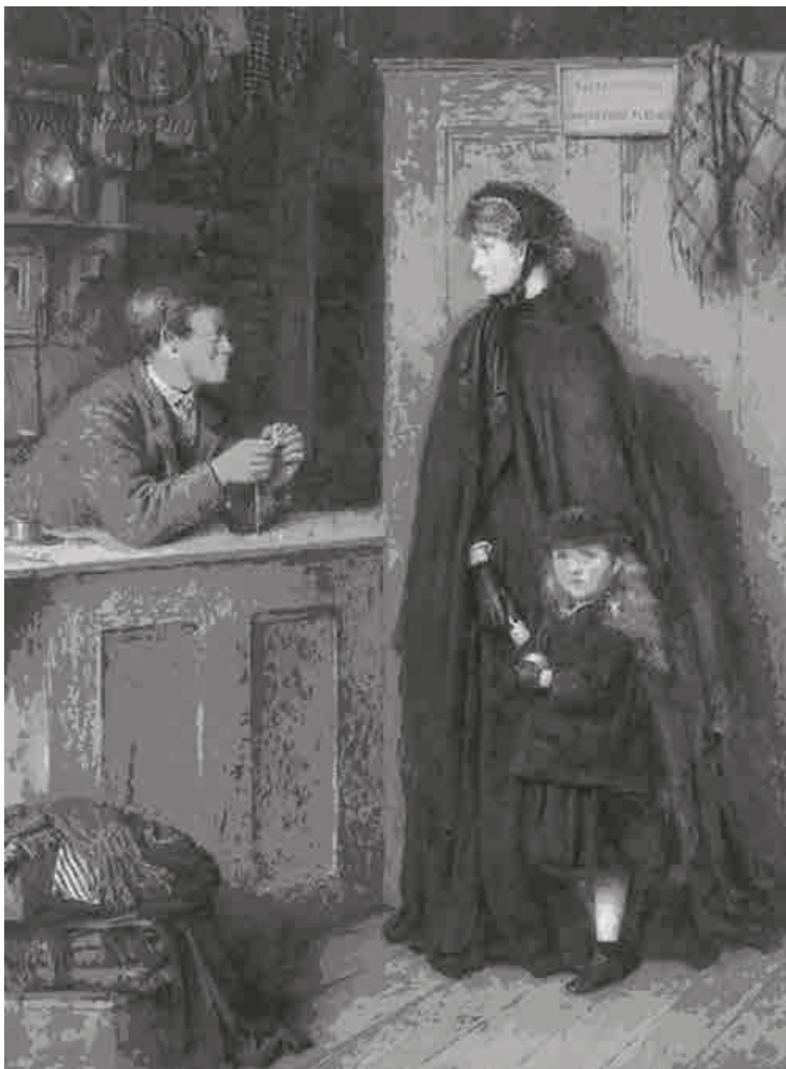
Джордж Гудвин Килбурн. В ломбарде

Не меньшей проблемой Викторианской эпохи, чем сословное и имущественное расслоение, было выраженное тендерное неравенство, демонстрировавшее присущий англичанам консерватизм и патриархальность мышления. Викторианский мир был в первую очередь мужским миром: мужчины безраздельно царили в политике, промышленности, науках и в церкви, тогда как женской прерогативой было ведение хозяйства и забота о семье, а положенное ей жизненное пространство ограничивалось преимущественно домом. Разумеется, это касалось прежде всего женщин среднего класса, но отношение к слабому полу содержало в себе ряд стереоти-