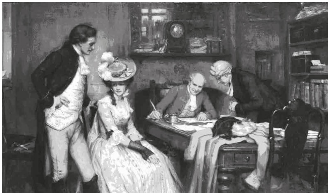
Джордж Шеридан Ноулз. Подписание брачного контракта. 1905

Некоторым все же удавалось это сделать, но результат больше походил на проигрыш, чем на победу: добрачные связи, адюльтер, развод, уход от супруга сурово порицались обществом и даже наказывались административно 19 . Женщина, рискнувшая выказать непокорность и несогласие с несправедливыми законами и правилами, теряла практически все, от доброго имени до возможности участвовать в воспитании собственных детей (при разводе или любом конфликте они оставались с отцом).