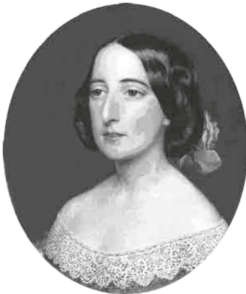
Джон Бретт. Миссис Ковентри Патмор. 1856

Подобно Беатриче и Лауре, которых Патмор упоминает в своей поэме, Эмили прожила достаточно короткую жизнь – в возрасте тридцати пяти лет она скончалась после тяжелой болезни. Вторая супруга поэта посвятила себя заботе о детях Ковентри и Эмили, а после ее смерти Патмор женился еще раз, на гувернантке своих детей. Незадолго до его шестидесятилетия третья жена подарила супругу сына. Драматичные повороты семейной жизни Ковентри Патмора представляли скорее типичный, чем исключительный случай 32 . Верное служение супругу, неустанная забота о многочисленных детях и смерть в родах или от болезней были частым уделом женщины Викторианской эпохи. В таком контексте «ангелизация» образа женщины приобретает трагическое звучание.