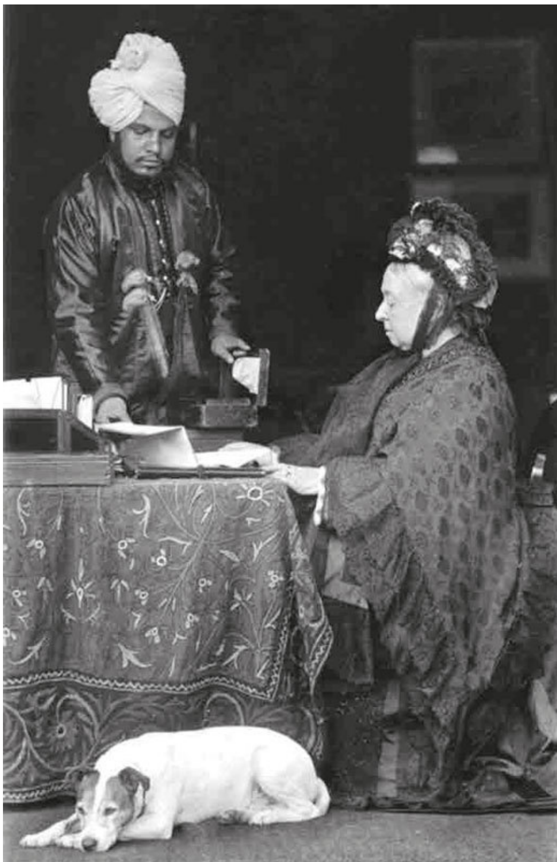
Виктория и Абдул. 1885

К ее двору прибыли два индийца, нанятые на службу в качестве лакеев.