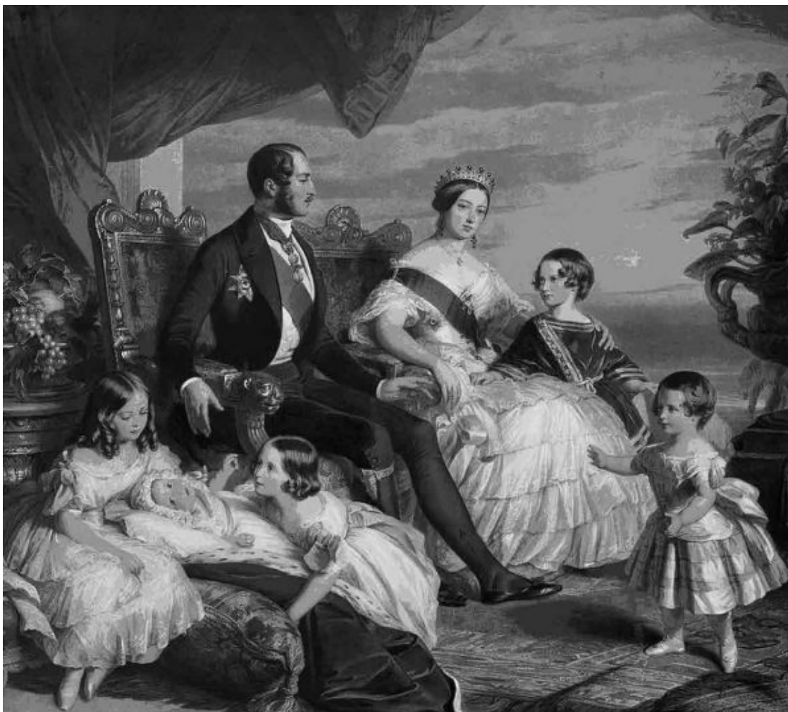
Франц Ксавьер Винтерхальтер. Альберт и Виктория с детьми

Принц Альберт, рано потерявший мать 23 и потому так ценивший тепло домашнего очага, разделял взгляды Виктории и не желал ставить семейное благополучие под угрозу ради мимолетных увлечений. Возможно, поэтому легкомысленное поведение их старшего сына, вступившего в связь с ирландской актрисой, шокировало венценосных родителей и заставило принца Альберта отправиться в Кембридж для серьезного разговора с наследником, несмотря на серьезное физическое недомогание. Во время беседы отец с сыном попали под сильный дождь, и Альберт сразу после возвращения слег с лихорадкой, от которой уже не оправился. Королева так и не простила принца Уэльского, считая его виновником смерти Альберта. Ее горе и негодование усугублялись тем, что их первенец так и не раскаялся в своем порочном поведении; напротив, со временем он превратился в одного из самых знаменитых распутников Европы, не оставлявшего без внимания ни актрис, ни куртизанок и посещавшего публичные дома. Хотя покойный принц Альберт был, по словам его супруги, воплощением добродетели,