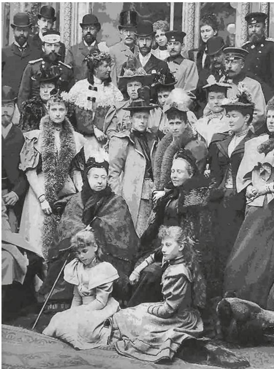
Королева Виктория в окружении детей и внуков

Семейная идиллия, представленная на многочисленных фотографиях и открытках – королева-матриарх в окружении многочисленных потомков, – оказалась постановочной и далекой от реальности. Однако подданные принимали эту лубочную картинку, подпитывающую их патриотизм, сентиментальность и роялистские настроения, за образец для подражания, стремясь соответствовать ей хотя бы внешне. Отсюда проистекала главная проблема викторианской морали: она была в первую очередь показной, а по своей сути ханжеской и лицемерной. Ключевой концепцией викторианского этикета была благопристойность, и она же определяла нрав-