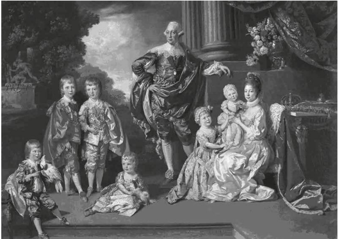
Йохан Цоффани. Георг III с семьей. 1770

Дед Виктории, король Георг III, был первым представителем Ганноверской династии в Великобритании, который ни разу не был на исторической родине своих предков – в Германии – и владел английским языком как родным. К сожалению, это не сделало из него хорошего правителя. За вычетом ряда военных побед (в частности, над Наполеоном при Ватерлоо в 1815 году) царствование Георга III вошло в историю как период внешних поражений и внутренних неурядиц. Наиболее ощутимыми из них были потери американских колоний в ходе Войны за независимость США и ряд политических кризисов, вызвавших стремительную смену нескольких премьер-министров и составов правительства. Газетные сатирики окрестили короля «Фермер Джордж» за его увлечение аграрными реформами и интерес к «домашним», повседневным вопросам в обход дел государственной важности, однако современники и потомки запомнили его в первую очередь как безумного Георга. Английский король страдал тяжелым наследственным заболеванием – порфирией, – не только причиняющим физические страдания, но и вызывающим помутнение рассудка. В 1811 году регентом при полностью ослепшем и окончательно обезумевшем Георге III был назначен его старший сын, будущий Георг IV