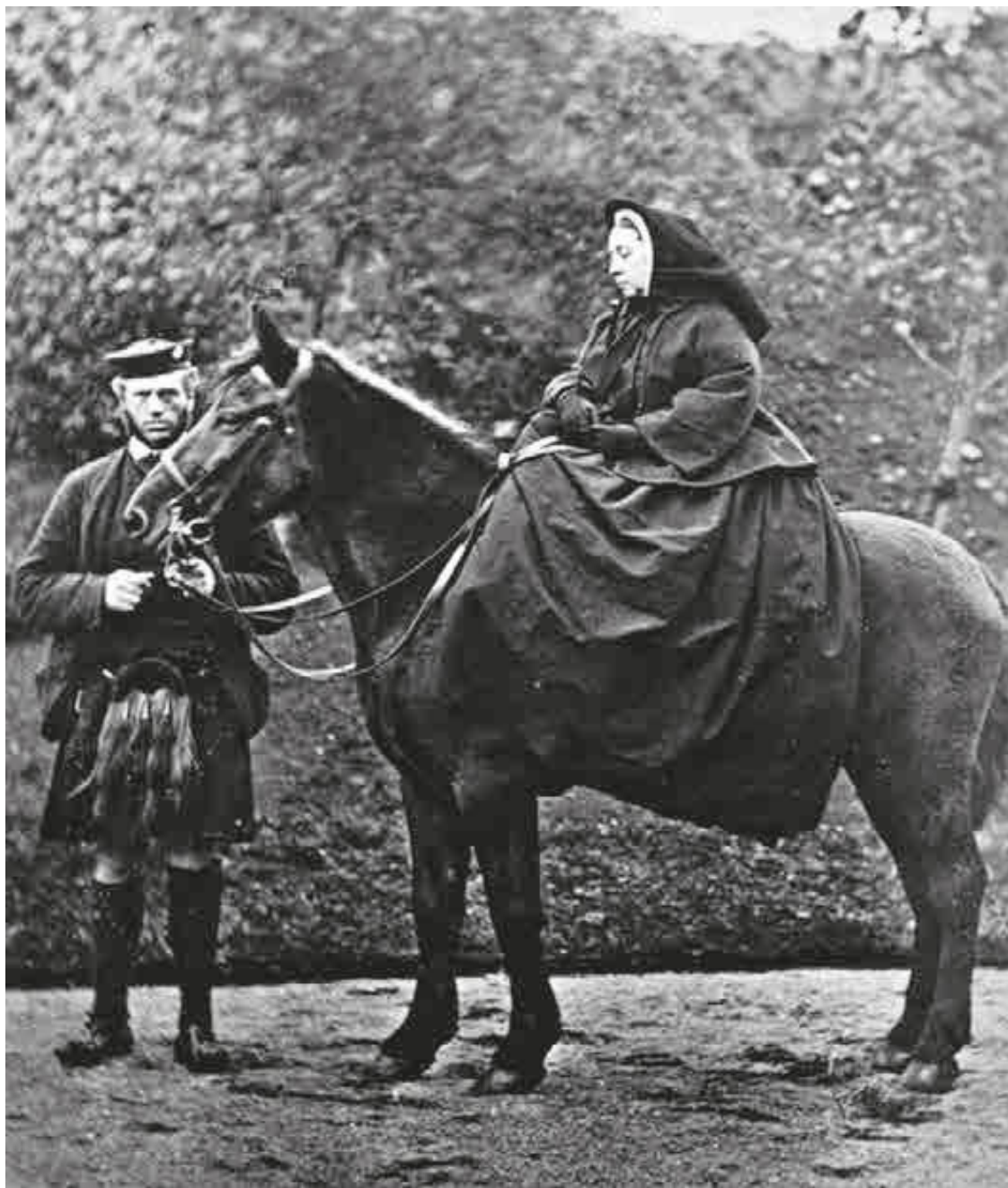
Королева Виктория и Джон Браун в замке Балморал. 1863

В память о горячо любимом супруге Виктория возвела множество монументов самого разного формата, от скульптурных памятников до учреждений, носящих его имя 16 .