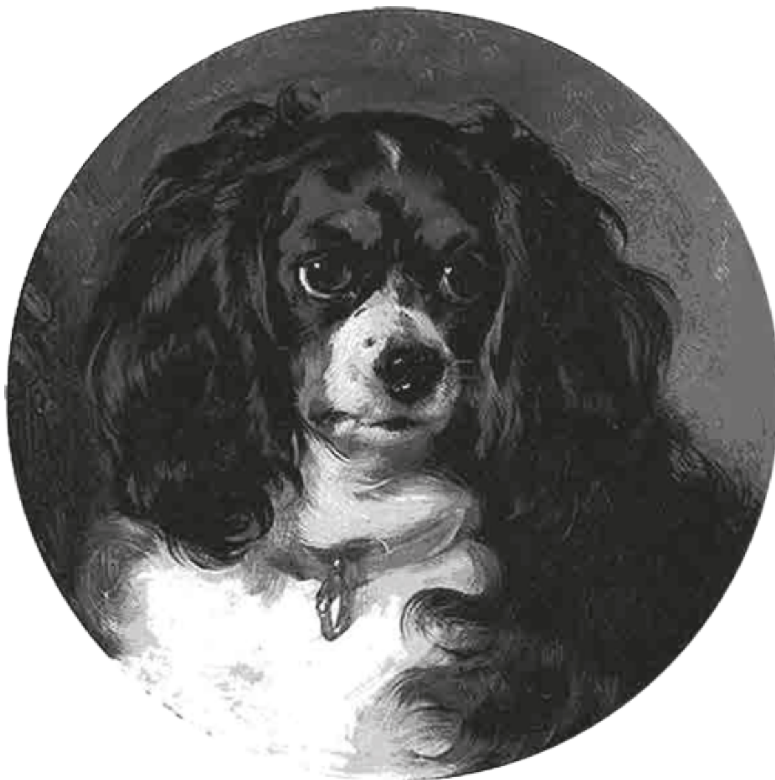
Эдвард Ландсир. Спаниэль Дэш (единственный друг юной принцессы Виктории)

Герцогиня Кентская и Конрой сообща разработали свод принципов и правил, призванных ослабить волю и характер Виктории и заставить ее полностью подчиняться матери и ее фавориту. Они назвали свое изобретение Кенсингтонской системой 11 , и пытались с ее помощью воспитывать принцессу, однако единственным отчетливым результатом ее применения стало растущее отчуждение между герцогиней и ее дочерью. Впоследствии королева Виктория описывала свое детство как одинокое и довольно безрадостное. Впрочем, пока юная принцесса сожалела об отсутствии подруг и нехватке времени для игр, тысячи ее ровесниц по всей стране страдали от голода, ужасных условий жизни, болезней и физического насилия. Возможно, вдовствующая герцогиня и была урезана в средствах, однако у принцессы всегда были красивые наряды, пони, экипажи и слуги, а коллекция деревянных кукол насчитывала более ста экземпляров. Кроме того, благодаря матери принцесса получила хоть и домашнее, но весьма