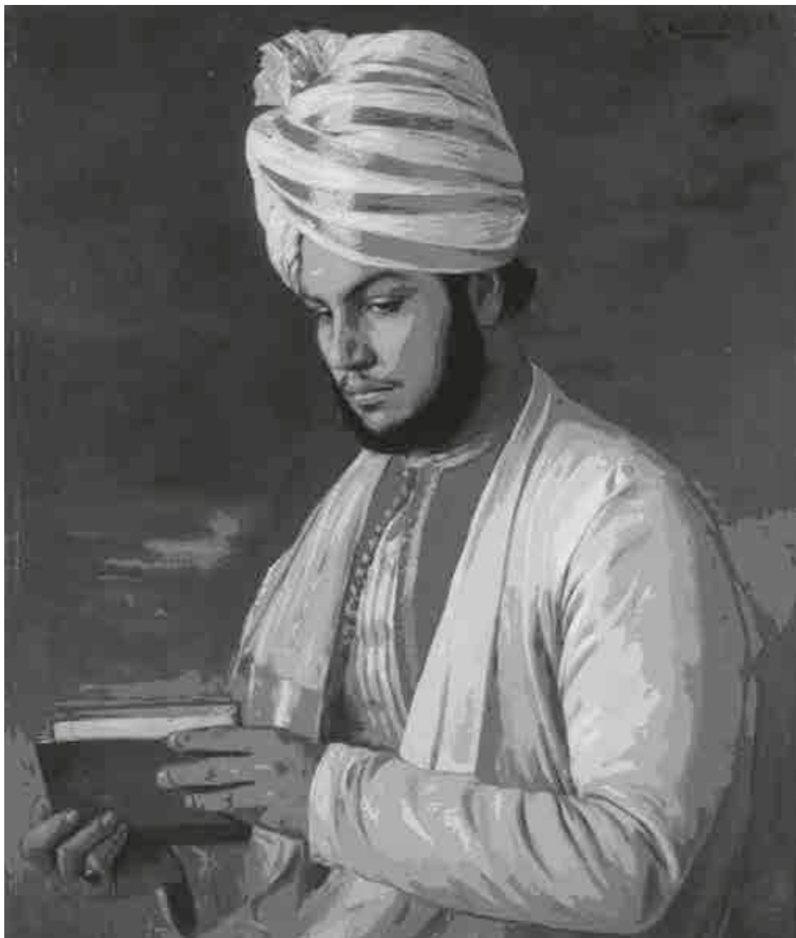
Рудольф Свобода. Портрет Абдула Карима 1888

Одним из приезжих был Абдул Карим (1863–1909), амбициозный юноша, обративший на себя внимание Виктории и в течение непродолжительного времени продвинувшийся с положения слуги до уровня секретаря королевы и консультанта по вопросам индийской культуры.