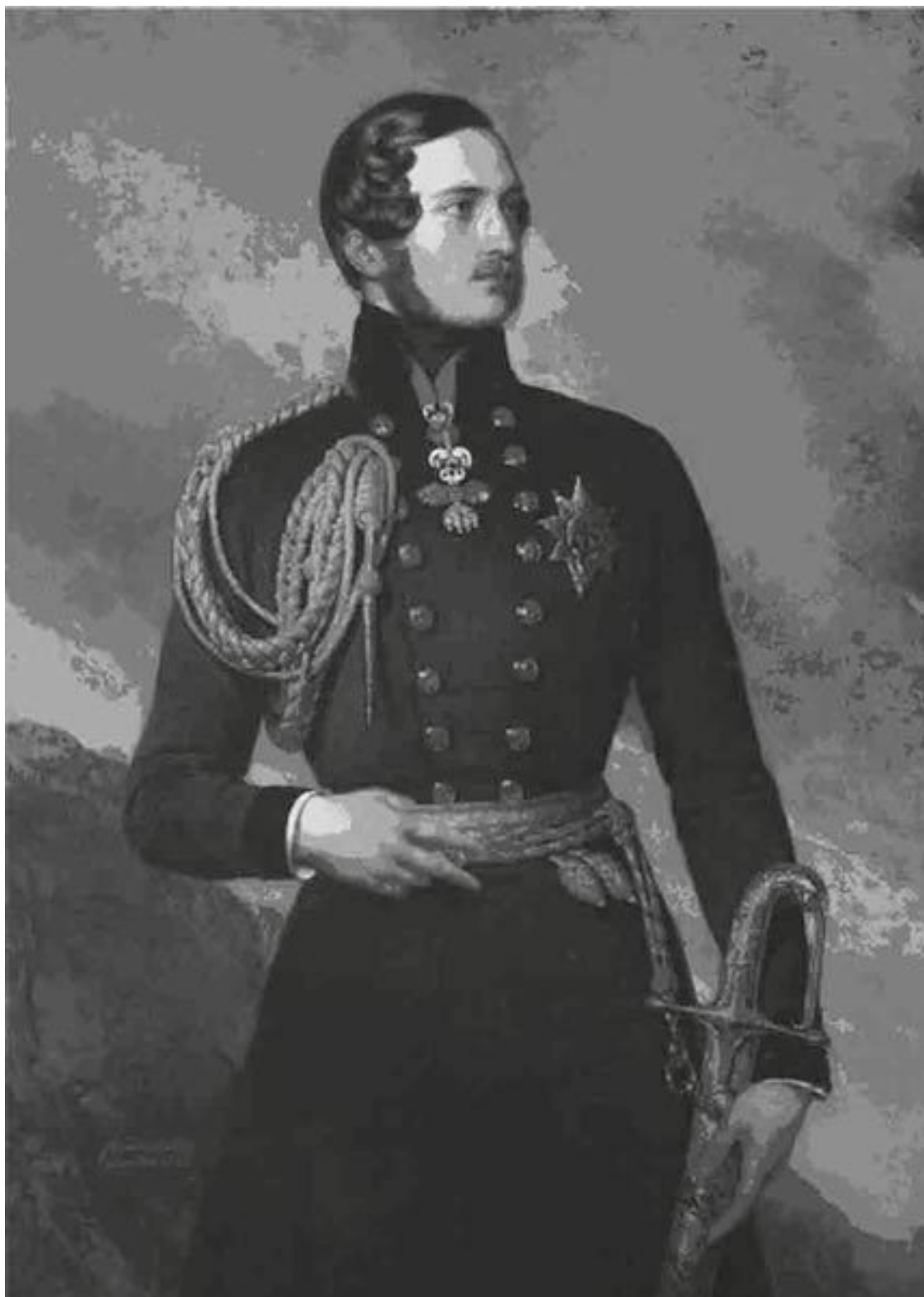
Франц Ксавьер Винтерхальтер. Принц Альберт. 1842

Ее выбор пал (хоть и не с первого раза) на ее кузена, принца Саксен-Кобург-Готского, который явно уступал невесте в размере состояния, влиятельности и политическом весе, зато обладал привлекательной внешностью. В отличие от королей и принцев Ганноверской дина-