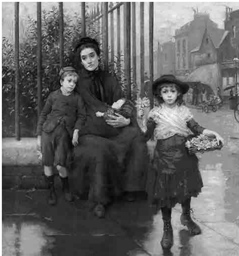
Томас Кеннингтон. Под гнетом нищеты