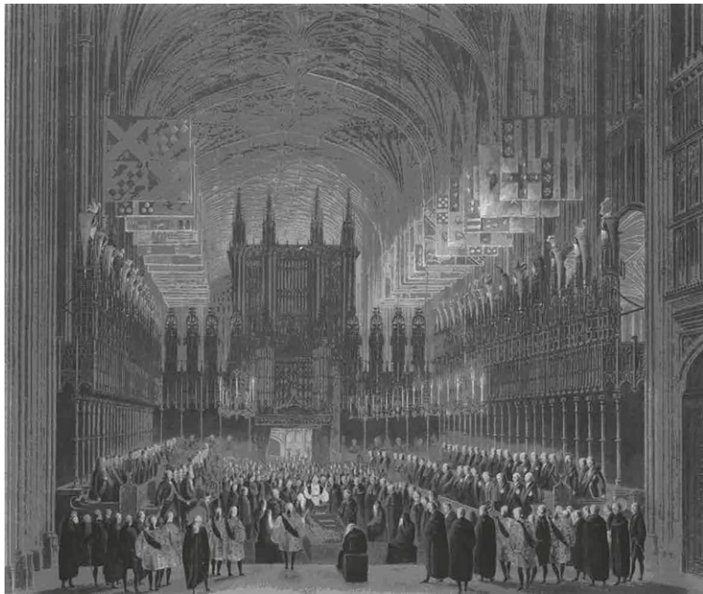
Литография Томаса Сазерленда. Погребальная церемония Ее Королевского Высочества принцессы Шарлотты. 1818