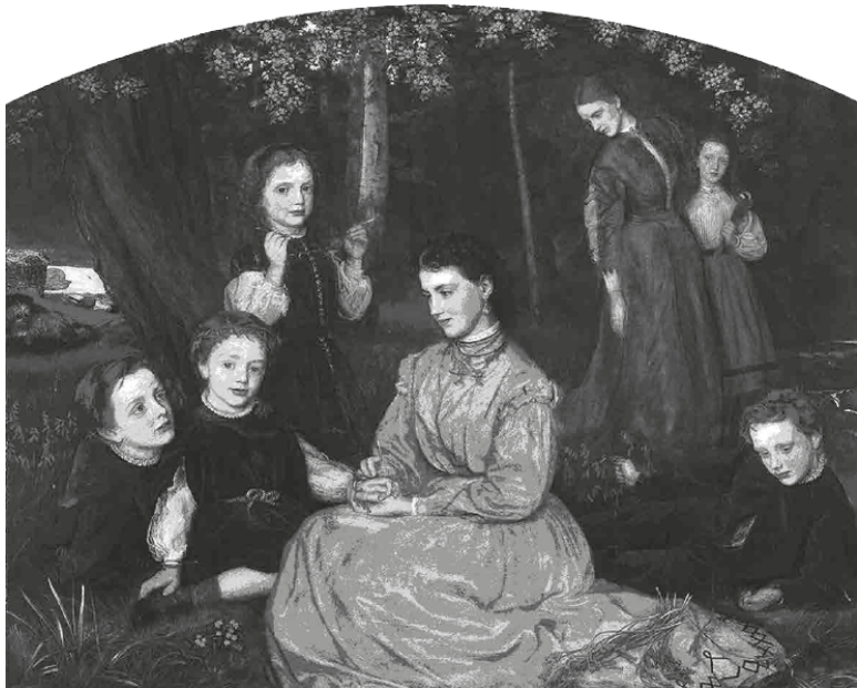
Артур Хьюз. Пикник в день рождения

Еще одним расхождением королевы Виктории с «ангельским» образом было ее влечение к супругу, даже некоторая одержимость его физической привлекательностью и стремление получать от супружеских отношений плотское удовольствие, о чем она весьма откровенно рассказывала в письмах и дневниках. Рядовой викторианской леди, не наделенной королевскими привилегиями, было запрещено выражать и демонстрировать чувственные порывы (а по сути, да-