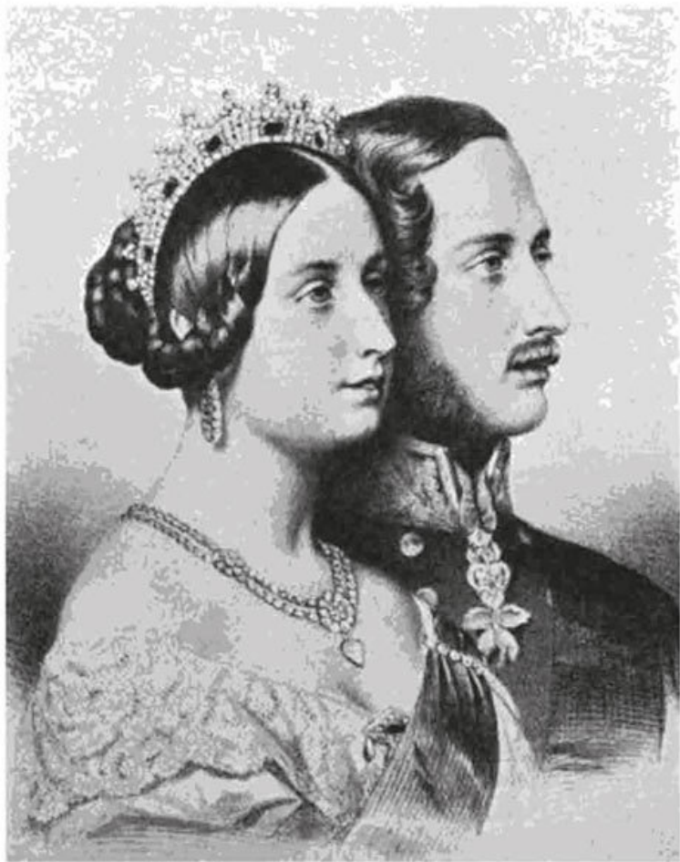
Королева Виктория и принц Альберт