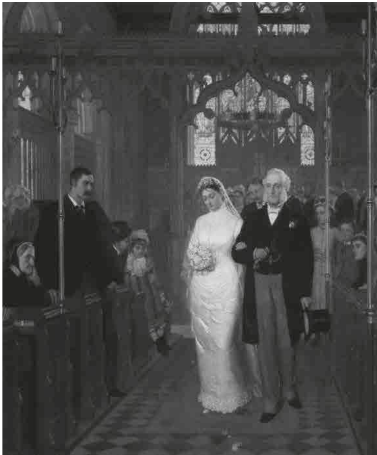
Эдмунд Блэр Лейтон. Пока смерть не разлучит нас