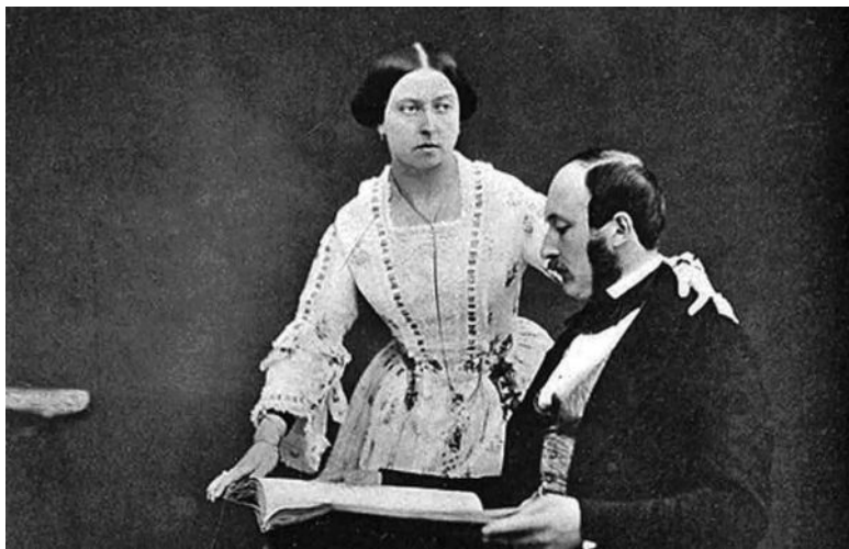
Виктория с принцем Альбертом. ок. 1854

«кто стучит?» смиренным «твоя жена» вместо привычного ей горделивого «королева Англии». Несмотря на то что корону носила из них двоих только она, да и вообще это был ЕЕ дворец и ЕЕ страна, она была в первую очередь замужней женщиной, которая должна всегда уступать супругу.