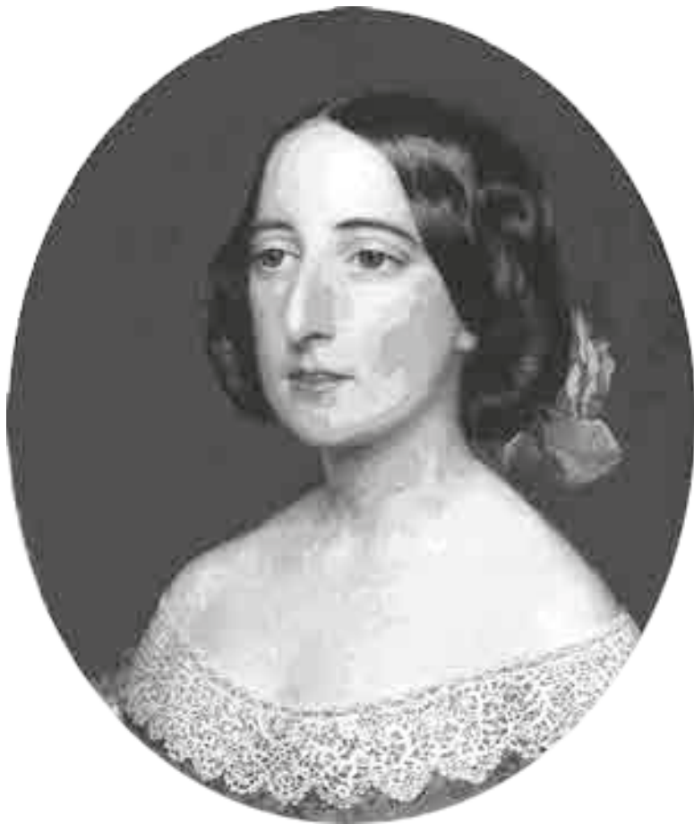
Джон Бретт. Миссис Ковентри Патмор. 1856

Подобно Беатриче и Лауре, которых Патмор упоминает в