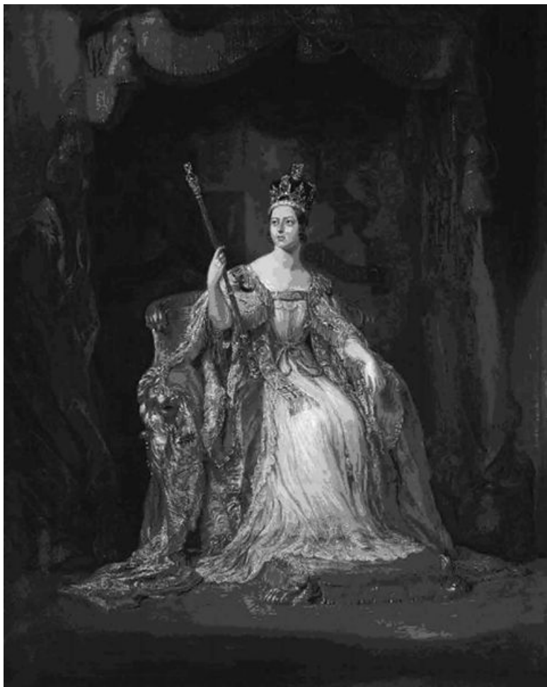
Джордж Хейтер. Портрет королевы Виктории в коронационном облачении, 1838. Виктория стала королевой в восем-