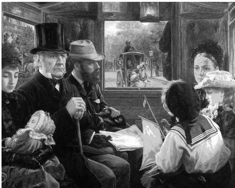
Альфред Морган. Лондонский омнибус на пути к площади Пикадилли. 1885

Эти правила касались в первую очередь среднего и высшего сословия, так как представителям рабочего класса было бы затруднительно игнорировать или маскировать бесчисленные заботы или свою вопиющую нищету. Сам факт существования в Англии – развитой индустриальной державе, владевшей колониями по всему миру, – безработицы, рабочих домов, огромного количества нищих и бездомных отра-