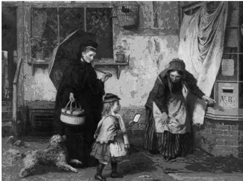
Джеймс Кларк Уайт. Утешение вдовы