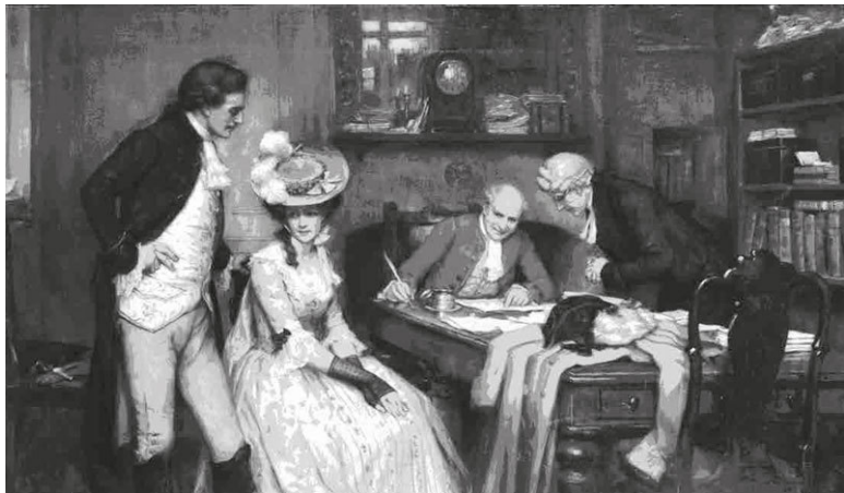
Джордж Шеридан Ноулз. Подписание брачного контракта. 1905

Финансовые разногласия также решались в пользу мужа: все средства жены, в том числе ее приданое и полученные или заработанные на протяжении совместной жизни средства, принадлежали ее супругу. Эти правила касались и семей из высшего сословия, так что дамы благородного происхождения не были застрахованы ни от потери имущества или вынужденной разлуки с детьми, ни от домашнего насилия, которое было распространенным явлением семейной жизни в XIX веке. К концу Викторианской эпохи некоторые из этих варварских законов стали пересматриваться, однако сама идея тендерного равенства была чужда этой эпохе, как