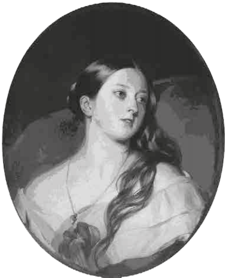
Франц Ксавьер Винтерхальтер. Портрет королевы Виктории. 1843