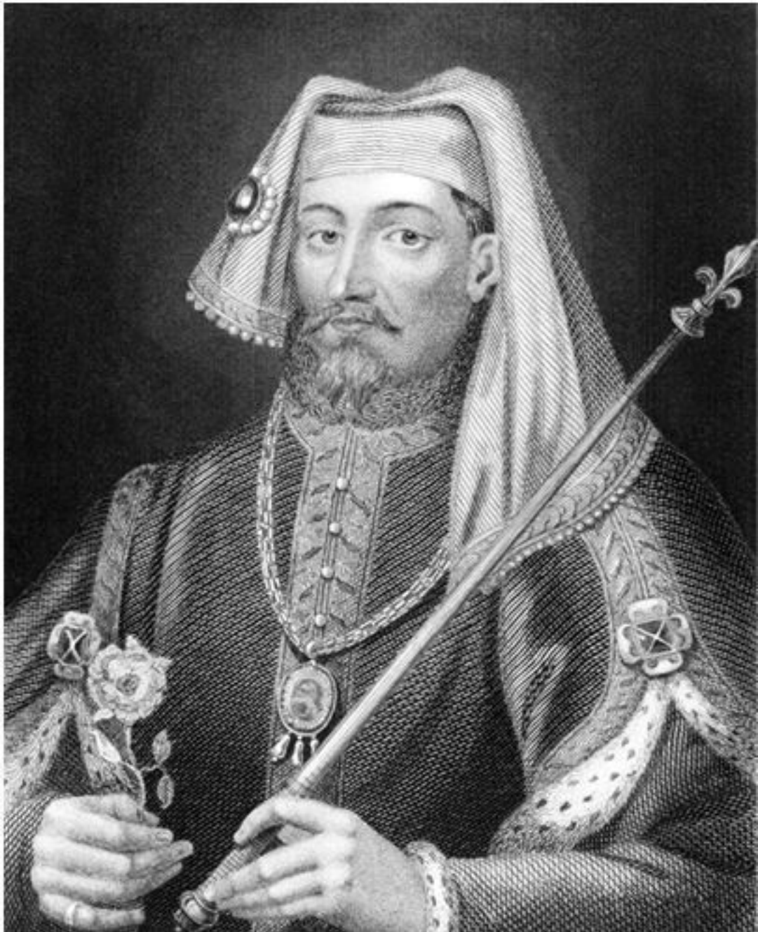
Король Генрих IV. (1366–1413). Гравюра Э. Боке из «Каталога венценосных и благородных авторов» (Catalogue of the Royal and Noble Authors) Х. Уолпола. Великобритания, 1806

ставляли радикальный отход от любых прежних практик. Королевские права Генриха IV основывались на трех принципах.