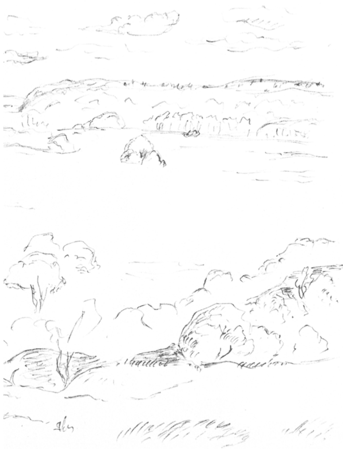
Малоярославец – вид с городища