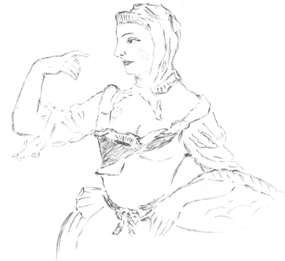
Статуэтка, фарфор. Мейсен, 1750-е гг.