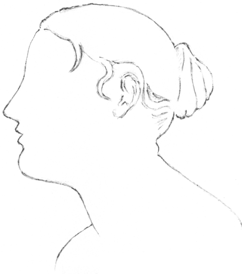
Скульптура «Смирение», Lorenzo Bartolini, 1834 г.