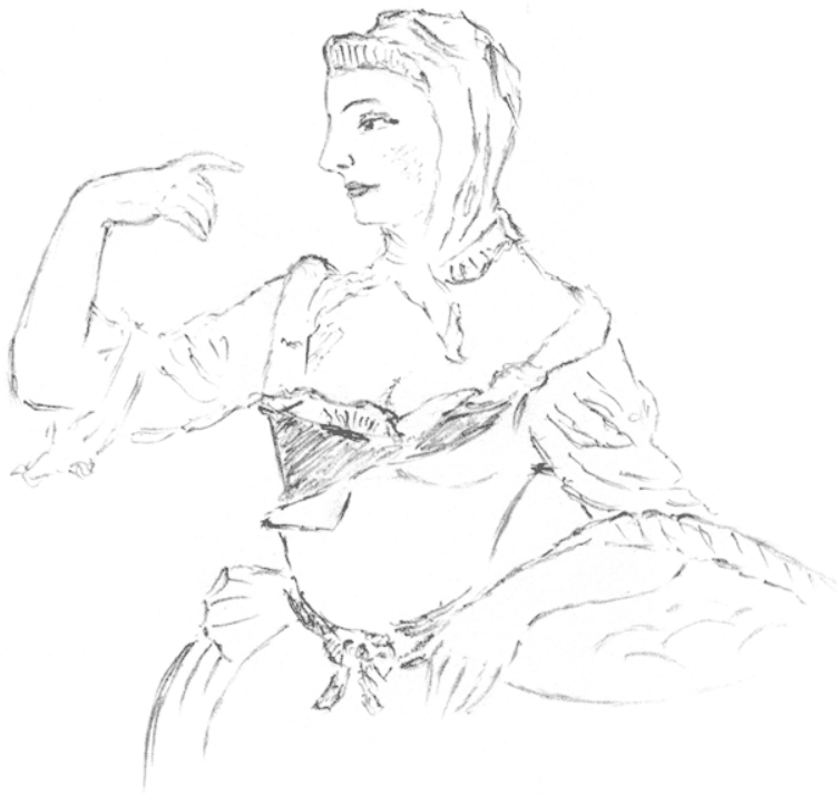
Статуэтка, фарфор. Мейсен, 1750-е гг.