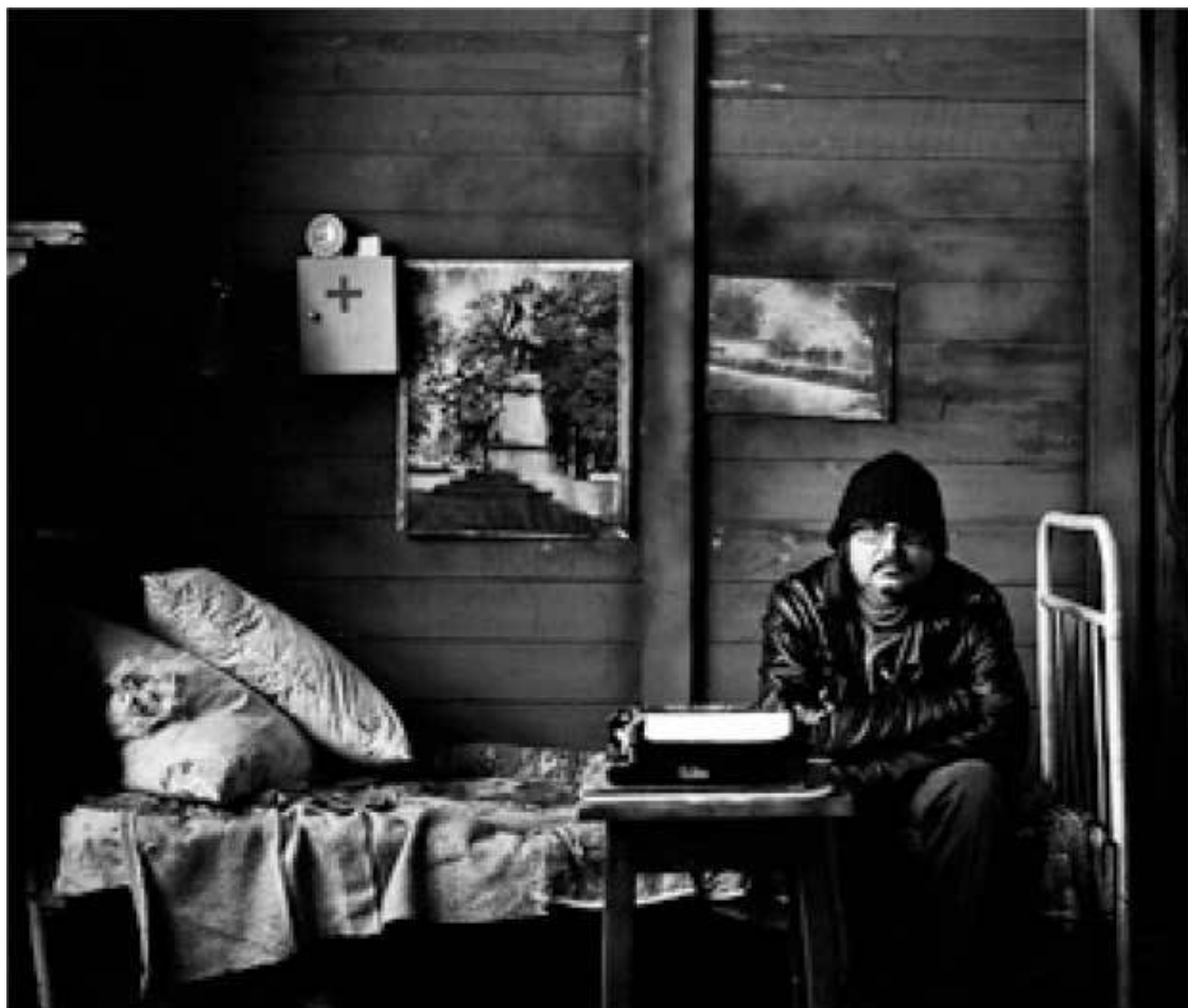
Режиссер Алексей Балабанов на съемках фильма «Кочегар». 2010