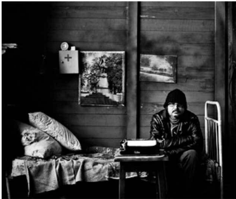
Режиссер Алексей Балабанов на съемках фильма «Кочегар».

Балабанов не входил ни в один лагерь. Это стало очевидным уже после «Брата». Я помню, как Петр Вайль, поклонник творчества Балабанова и, в частности, «Замка», попытался поговорить с режиссером о его «Брате» после премьеры в Сочи. Балабанов отшучивался: «Да просто я родину люблю». Или: «Да просто наш народ так думает: не любят у нас евреев, ведь так оно и есть на самом деле». Не желая