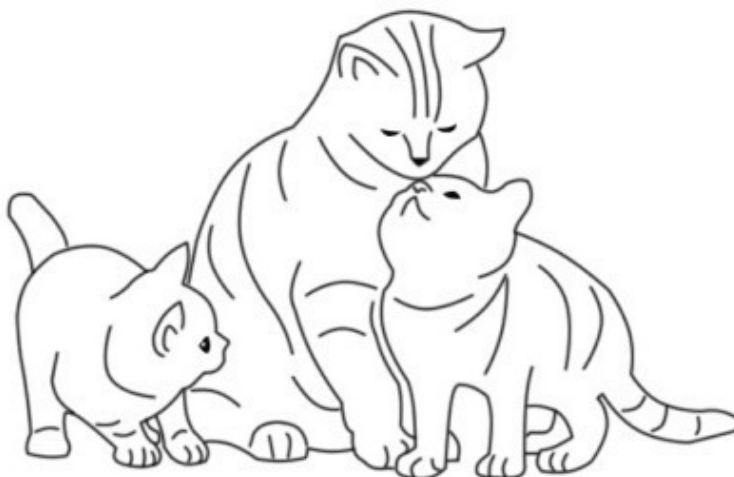
Рис. Светланы Шаталовой

Были у мамы-кошки два маленьких котёнка: дочка Буся и сынок Михась. Мама любила их одинаково сильно, но Бусе казалось, что мама больше любит Михася, а Михась думал, что мама больше любит Бусю. Из-за этого они всё время ссорились и даже дрались.