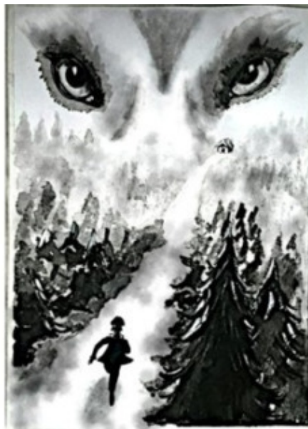
Рис. Елены Бондаревой

Мальчик шагнул. Огромная луна свирепым светом озаряла дорогу сада. Вдруг справа послышался шорох. Жан насторожился, раздалось тихое «у-у-у». «Это же Волк-призрак воет!» – мальчик замер, съёжился от ужаса, а потом побежал что было сил. Его сердечко бешено колотилось. «Только бы скорее добраться до сарая! Закрыться, и я спасён!» – так думал маленький повараёнок, а страх гнал его быстрее вперёд.