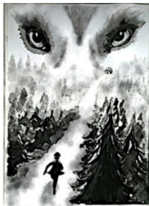
Рис. Елены Бондаревой

Мальчик шагнул. Огромная луна свирепым светом озарила дорогу сада. Вдруг справа послышался шорох. Жан насторожился, раздалось тихое «у-у-у». «Это же Волк-призрак воеет!» – мальчик замер, съёжился от ужаса, а потом побежал что было сил. Его сердечко бешено колотилось. «Только бы скорее добраться до сарая! Закрыться, и я спасён!» – так думал маленький поварёнок, а страх гнал его быстрее вперёд.