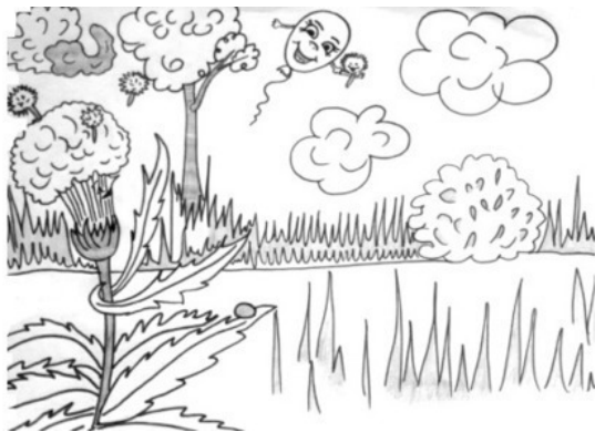
Рис. Людмилы Лесной

Каждый день одуванчик ждал встречи, смотрел на небо в надежде увидеть воздушный шар.