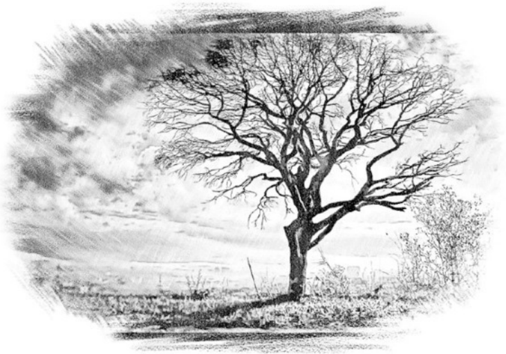
Рис. Светланы Крюковой

«Что с тобой случилось? Где твой наряд и почему ты стоишь в полной тишине?» – спросила девочка. Дерево молчало. Но девочка и не думала сдаваться: «Больше всего на свете я люблю качаться на качелях, слушать и рассказывать сказки. Поэтому, если хочешь – молчи, а я расскажу тебе свою любимую сказочную историю».