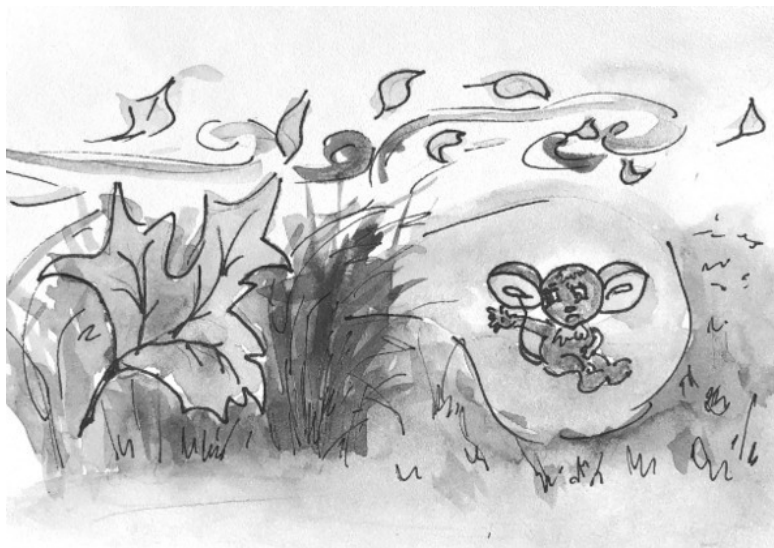
Рис. Теи Либелле «Герой-мышонок»

Рассвирепевший лис царапал лапой кору орешника, поднимая вверх ворох опавшей листвы. Листья кружили вокруг лиса и опускались плотным одеялом на расщелину в стволе дерева. Мышонок ждал, перестав дышать.