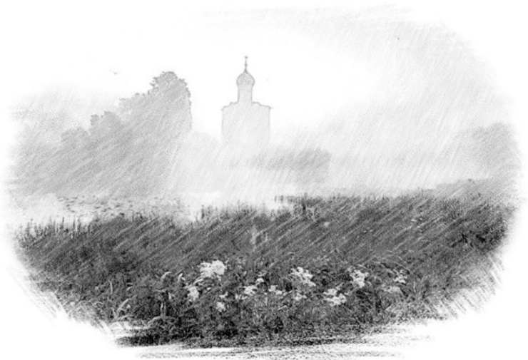
Рис. Светланы Крюковой

Пошёл Огнеслав к Илие, стал с ним разговор вести, что негоже людей от дела отучать да жизнь леса сокращать. «Посмотри вокруг, деревья гибнут, на поляне возле озера ни одной травинки не растёт, птицы не поют», – сокрушается Огнеслав. А Илия так долго в шуме да гаме прожил, что ничего из слов Огнеслава не услышал, лишь рукой махнул да обратно к озеру идти собрался.