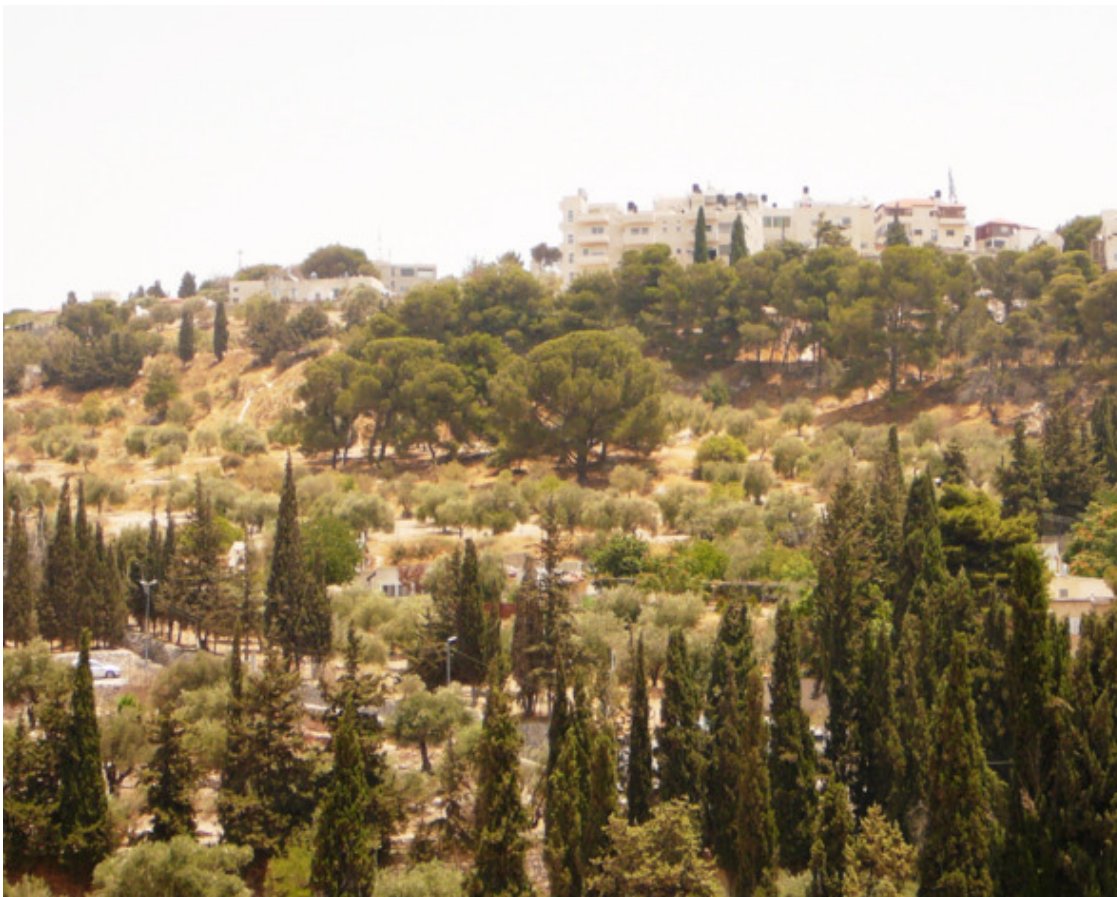
Масличная гора в Иерусалиме

К слову, «елей» – это и есть чистейшее оливковое масло