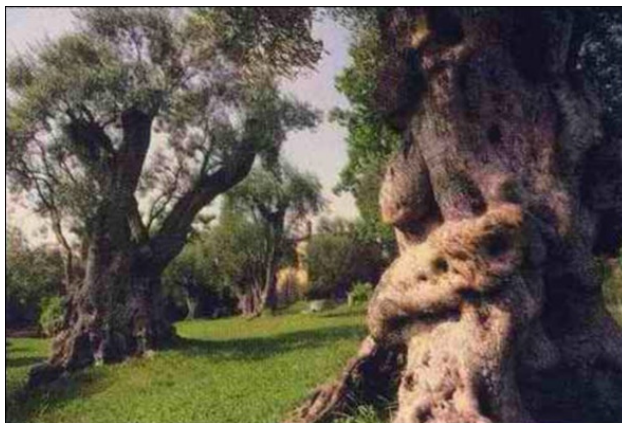
Огюст Ренуар. Старые оливы

Некоторые деревья этой рощи посадил еще Франциск 1 во время перемирия в войну, которая шла в 16 веке. Все они вымерзли во время великих заморозков в Провансе в 1709 году. Тогда у многих деревьев погибла вся крона. Старейшие оливы на картинах Ренуара хранят следы перенесенных тягот, скрюченные ветки, оголенные корни, шрамы от утраченных ветвей.