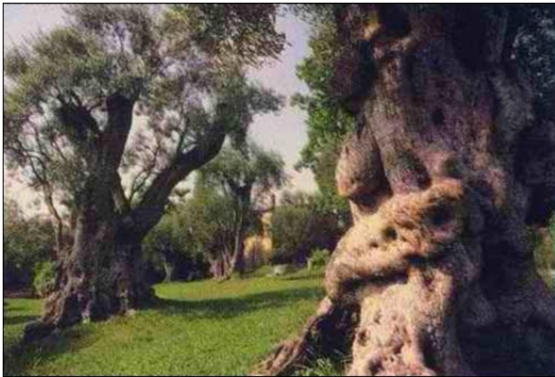
Огюст Ренуар. Старые оливы

Об этом вспоминает Ричард Мейби в своей книге «Какое дерево росло в райском саду? 40000 лет великой истории растений». В этой книге Richard Maybe рассказывает какая огромная жизненная энергия, выносливость и стойкость есть у деревьев, живущих своей собственной жизнью, не всегда понятной человеку.