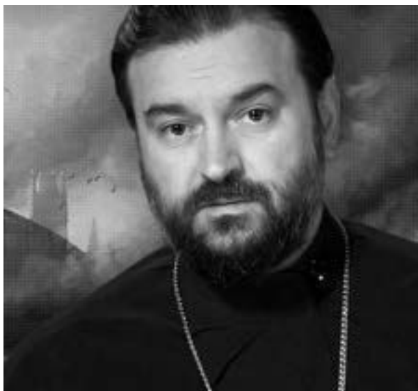
Протоиерей Андрей Ткачев