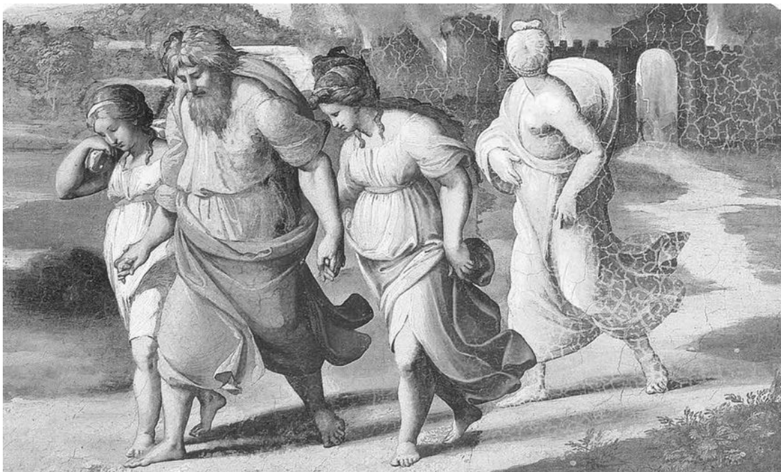
Бегство Лота из Содома. Рафаэль. XVI век

А до этого часа праведники не носят отличительных внешних знаков. Их никто не знает в этом качестве, и сами они вряд ли уверены в своем избранничестве. Но когда мера общих беззаконий переполнится, и миловать уже будет поздно, а карать необходимо, праведник будет спасен, «как бы из огня». И праведность его окажется не абсолютной. В безопасной обстановке, как в случае с Лотом, она окажется относительной, даже сомнительной, хотя внутри Содома Лот был выше всех (в нравственном отношении) на голову.