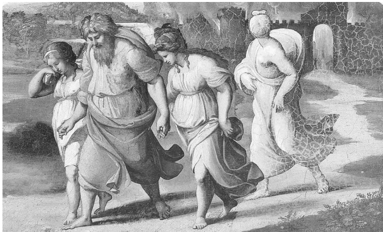
Бегство Лота из Содома. Рафаэль. XVI век

Если в городе нет праведников, то город долго не простоит. Если там один праведник, Бог найдет способ вывести этого одного, а с остальными поступить, как положено. Все это – не что иное, как нравственное обоснование продолжающегося бытия мира. Что-то мы знаем о мире и о законах его развития. Но это «что-то» по сути – ничего.