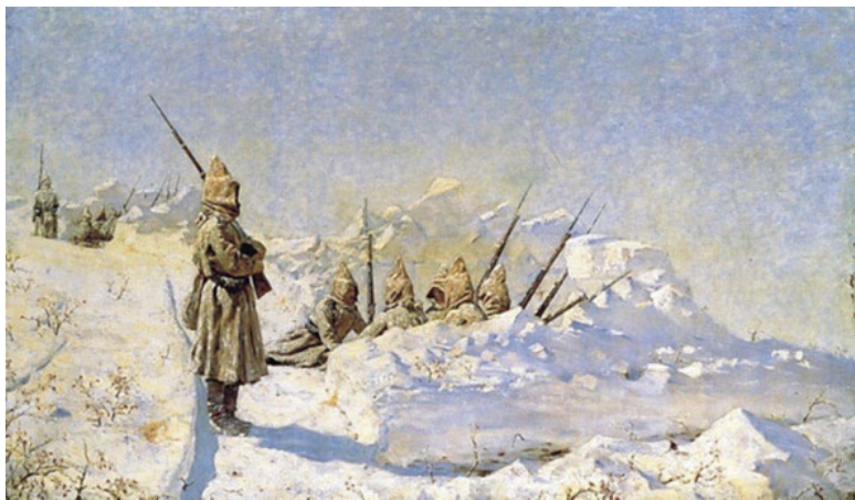
Снежные траншеи. Русско-турецкая война, 1877—1878. Василий Васильевич Верещагин (1842—1904)