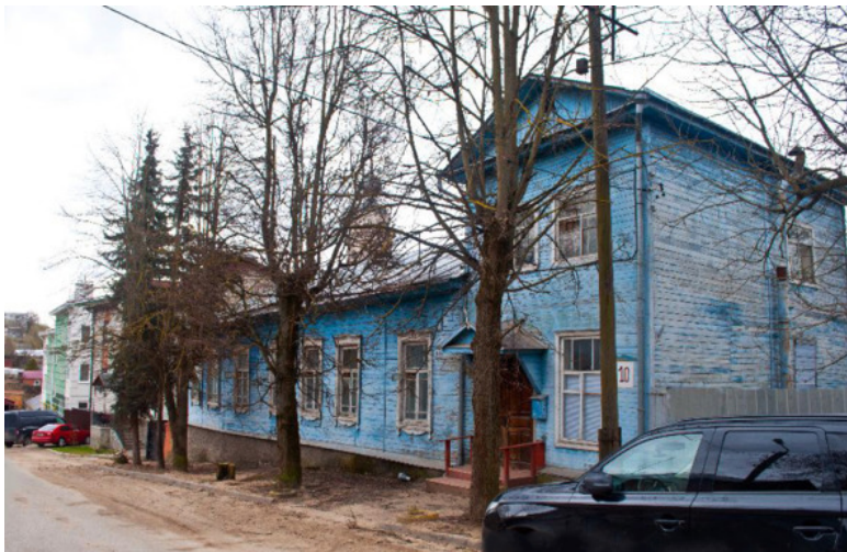
Дом Доброхотовых на ул. Красная (Баранова) Гора, Калуга