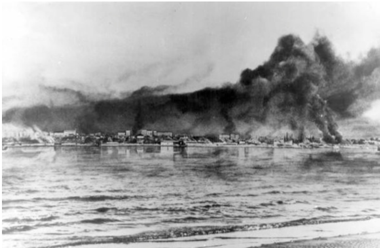
Горит Волга. Сталинград, 1942 г.

А в самой Соколовке стояла напряженная тишина. Военные все ушли на подготовленные позиции, окопались на холмах, с которых еще в прошлую зиму мальчишки и девчонки соколовские лихо съезжали на салазках. А теперь мы, население, отсиживались в погребах, рядом с бочками засоленных огурцов и горкой спелых арбузов или в подполе своей же избы. Деревню ни разу не бомбили, бомбы рвались у самой Волги, а к нам долетали осколки. Сперва мы их собирали: блестящие, причудливой формы, в зазубринах. Потом их в огородах, прилегающих к холмам, сгребали граблями... Доносившийся к нам свистящий вой и треск взры-