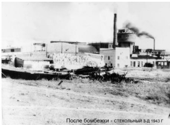
После бомбежки - СТЕКОЛЬНЫЙ З-Д 1943 г

Стекольный завод на берегу Волги, недалеко от Соколовки, куда Бабушка устроилась на работу