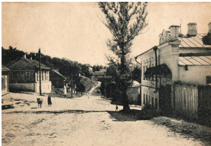
Улица Баранова Гора, старая Калуга