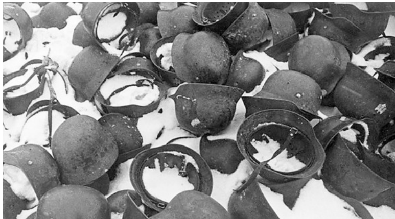
Горы солдатских касок