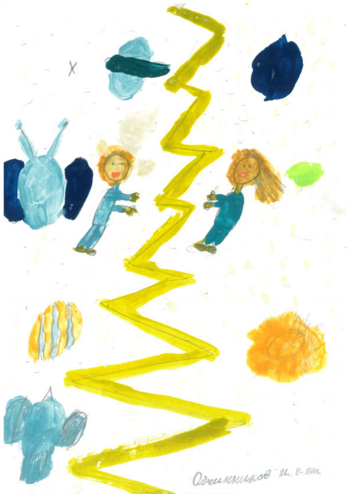
Ваня, 8 лет

Вот так появилась планета, где существует две стороны, благодаря сыну бога Ахавы и принцессе с планеты Нибиру.