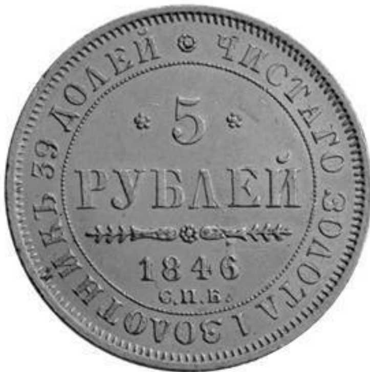
Рисунок 1 Золотые монеты царской России