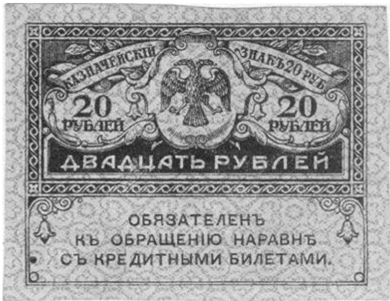
Рисунок 3 «Керенки»

«С победой октябрьской революции советская власть преступила к последовательному осуществлению своей финансовой программы. Страхование было национализировано. Одной из первоочередных задач советской власти было построение новой финансовой системы. Для этого необходимо было централизовать все финансовые отношения в государстве. Экспроприировать денежные накопления буржуазии, перейти к налоговой системе, основанной на прогрессивно-подходящем и поимущественном обложении доходов.