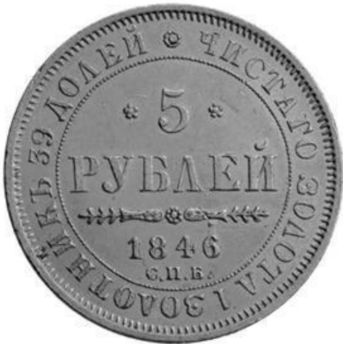
Рисунок 1 Золотые монеты царской России