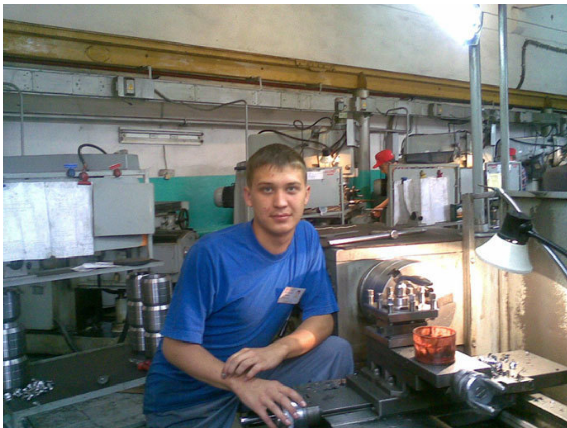
17 лет. работа за токарным станком

У меня были хорошие и там, и там отношения с руководством, токарь я и вправду получился не деревянный, а очень способный, несмотря на все прогулы и свой юный возраст. Папе за это огромное спасибо. Он научил меня относиться к деталям как к игрушкам, они должны быть идеальными, как у ювелира.